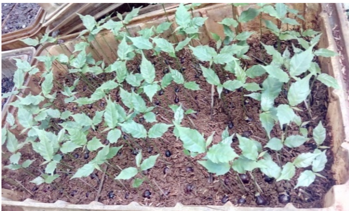
Gambar (Figure) 6. Aphanamixis polystachya 30 hari setelah tanam ( Aphanamixis polystachya 30 days after planting)

Berdasarkan hasil analisis sidik ragam berbagai perlakuan media berpengaruh nyata terhadap parameter nilai kecambah benih kayu gula. Perlakuan media pasir memiliki nilai kecambah tertinggi yaitu 13,80 %. Sedangkan nilai kecambah terendah adalah pada media tanah 7,52%. Benih dengan nilai kecambah tinggi juga akan mampu tumbuh menjadi bibit dengan optimal (Tambunsaribu et al. , 2017).