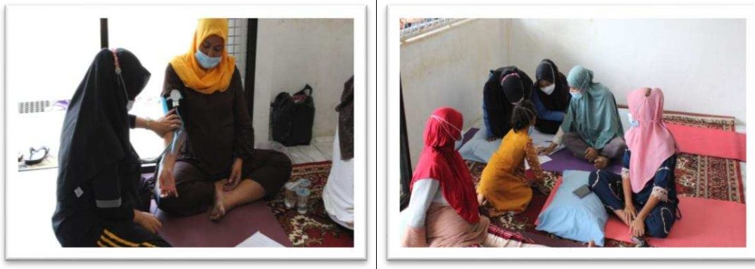
Gambar 1. Pemeriksaan Kesehatan Fisik dan Mental Ibu

Gambar 1 merupakan kegiatan pemeriksaan fisik dan mental kepada ibu yang dilakukan oleh pengabdian sebelum dan sesudah melakukan prenatal yoga. Kegiatan ini dilakukan untuk melihat kondisi kesehatan ibu sebelum melakukan prenatal yoga, karena ada syarat-syarat tertentu untuk melakukan prenatal yoga salah satunya adalah peserta harus dalam kondisi sehat.