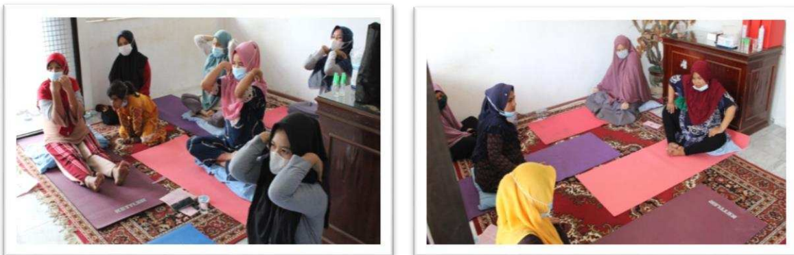
Gambar 2. Pelaksanaan Prenatal Yoga

Gambar 1 merupakan kegiatan pemeriksaan fisik dan mental kepada ibu yang dilakukan oleh pengabdian sebelum dan sesudah melakukan prenatal yoga. Kegiatan ini dilakukan untuk melihat kondisi kesehatan ibu sebelum melakukan prenatal yoga, karena ada syarat-syarat tertentu untuk melakukan prenatal yoga salah satunya adalah peserta harus dalam kondisi sehat.