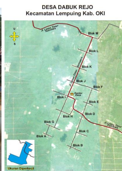
Gambar 3. Lokasi Kegiatan

Lokasi kegiatan penyuluhan yakni di Balai Desa Dabuk Rejo tepatnya di Jln. Lintas Timur Blok I Desa Dabuk Rejo, Kecamatan Lempuung Kab. Ogan Komering Ilir, Palembang-