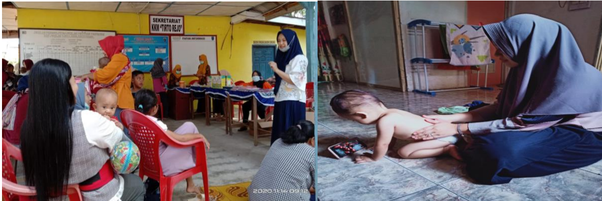
Gambar 2. Pelaksanaan Kegiatan Penyuluhan

Hasil penyuluhan disajikan dalam beberapa bagian yakni data umum dan khusus. Data umum berisi umur, jenis kelamin, status kesehatan. Data khusus menyajikan kualitas tidur balita usia 11 – 25 bulan sebelum dilakukan massage dan setelah diberikan massage , serta tingkat pengetahuan para ibu mengenai fungsi dan peran fisioterapi.