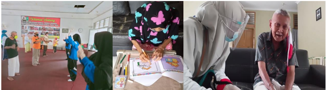
Gambar 1. Kegiatan Brain Gym , Art Therapy , dan Reminiscence Therapy

Gambar di atas adalah beberapa kegiatan yang dilaksanakan oleh tim pengabmas. Diawali dengan pengkajian dan screening terlebih dahulu kemudian menetapkan jumlah lansia yang dapat mengikuti kegiatan. Selanjutnya seluruh rangkaian kegiatan pengabmas dilakukan dengan protokol kesehatan.