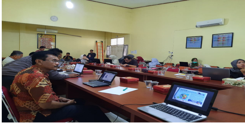
Gambar 1. Pelatihan Sister Di Fakultas Pertanian

aplikasi keluaran dari Kementerian Pendidikan Kebudayaan dan Pendidikan Tinggi Republik Indonesia. Aplikasi ini berfungsi mencatat semua identitas dosen berupa data diri, riwayat pendidikan, riwayat jabatan fungsional, riwayat pendidikan, riwayat pelaksanaan pendidikan, riwayat penelitian, riwayat pengabdian kepada masyarakat serta data pendukung lainnya.