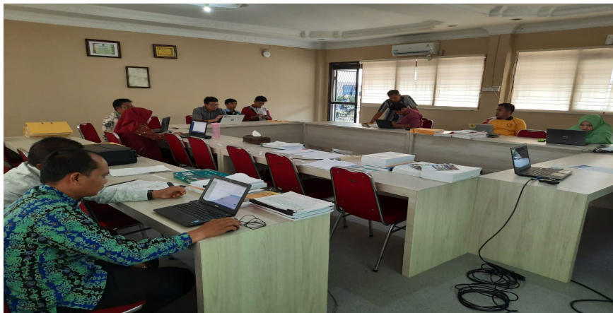
Gambar 2. Pelatihan Sister Di Fakultas Administrasi