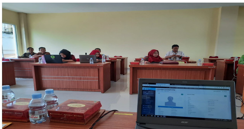
Gambar 3. Pelatihan Sister Di Pasca Sarjana

Kegiatan tersebut dilaksanakan dengan metode seminar. Pada tahapan pertama dosen diarahkan untuk mendaftar akun sister. Kemudian para dosen diarahkan untuk melengkapi data diri yang