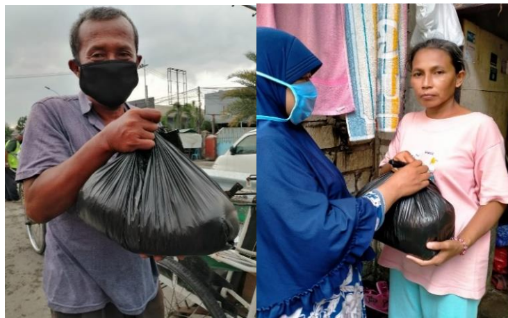
Gambar 3. Penerima bantuan bahan pangan oleh tukang becak dan pedagang di sekolah

Penyaluran paket sembako dilakukan secara langsung yaitu diserahkan langsung kepada obyek penerima berdasarkan data yang diperoleh. Respon penerima paket sembako sangat senang dan membantu untuk memenuhi kebutuhan hidup serta berharap dapat menerima setiap minggu selama proses PSBB. Dokumentasi proses dibutuhkan sebagai bentuk tanggung jawab team kepada para dermawan bahwa sasaran penyaluran bantuan sesuai dengan tujuan dari pengabdian ini dan juga wujud dari kepercayaan. Kegiatan ini berlangsung dengan baik dan lancar serta mendapatkan respon yang positif dari berbagai pihak khususnya pihak yang mendapatkan posting flayer kegiatan ini. Berikut adalah dokumentasi ketika pemberian bantuan kepada tukang becak, pedagang, karyawan yang terkena PHK dan lansia, seperti terlihat pada Gambar 3 dan Gambar 4.