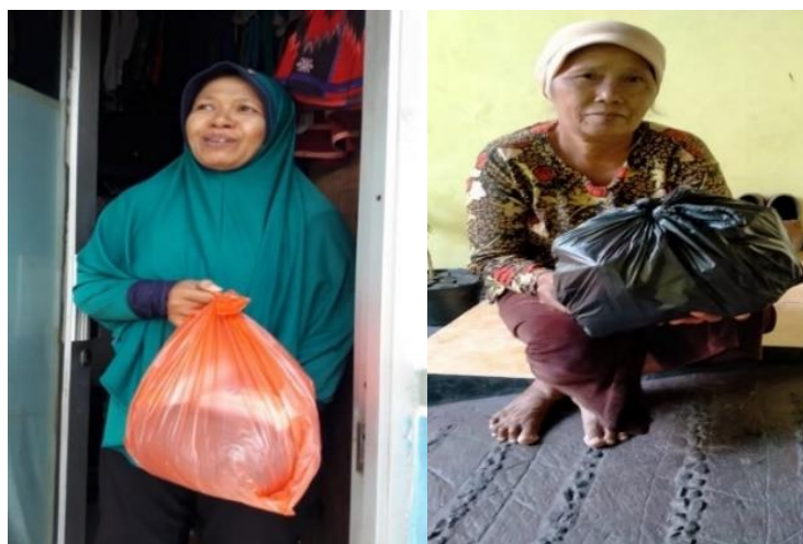
Gambar 4. Penerima bantuan bahan pangan kepada karyawan yang terkena PHK dan lansia