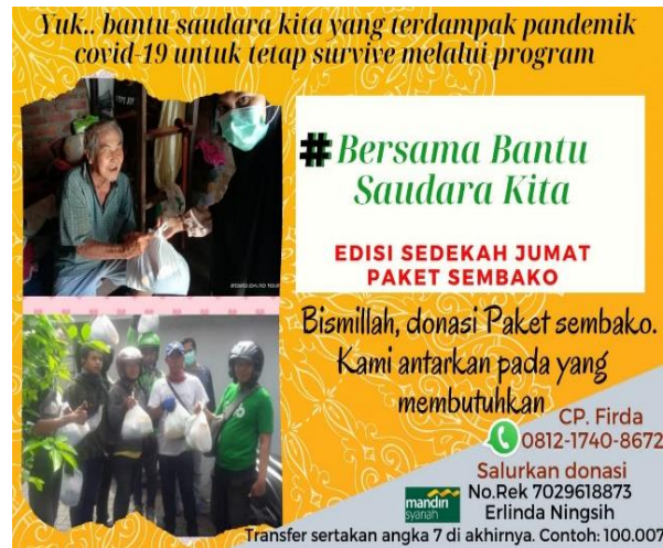
Gambar 2. Flyer Penggalangan Dana

ini karena adanya perencanaan yang telah disusun berdasarkan survey atau identifikasi serta dilakukan koordinasi dengan pihak RW RT setempat, seperti terlihat pada Gambar 2.