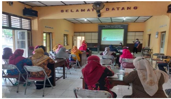
Gambar 9. Pelaksanaan Pelatihan Pemantauan Kesehatan Balita dan Bumil Secara Luring

Pada Bulan Oktober 2021, tim pengabdian melakukan kegiatan pendampingan pelatihan dalam pemanfaatan aplikasi SIKIA, pengisian data balita dan ibu hamil, serta pelatihan pemantauan tumbuh kembang balita dan kesehatan ibu hamil. Pelatihan dilakukan menggunakan metode daring menggunakan zoom meeting pada saat masih adanya pembatasan pertemuan akibat pandemi Covid-19 dan dilakukan secara luring dengan protokol kesehatan yang ketat setelah pemerintah memperbolehkan kegiatan tatap muka.