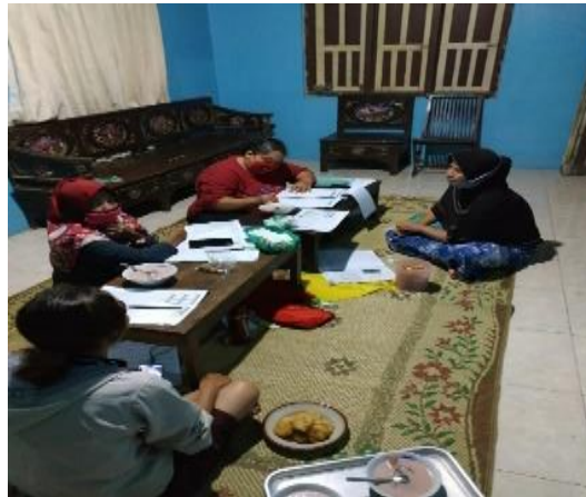
Gambar 1. Kader Melakukan Pencatatan dan Koordinasi untuk Kompilasi Data Hasil Kegiatan Posyandu

dalam pemantauan kondisi kesehatan ibu hamil, menyebabkan kader akan langsung merujuk ibu hamil untuk mendapatkan pemeriksaan melalui puskesmas (Azhar et al., 2020). Tugas kader hanya berfokus pada pendaftaran, penimbangan balita, pengisian KMS, Pemberian Makanan Tambahan (PMT) pada balita dan ibu hamil yang mengalami Kekurangan Energi Kronis (KEK). Fungsi penyuluhan oleh kader tidak dapat dilaksanakan dengan baik sehubungan dengan keterbatasan pengetahuan dan ketrampilan kader. Pemahaman Ibu hamil dan kader dalam pemanfaatan buku Kesehatan Ibu dan Anak (KIA) di Desa Triharjo juga masih rendah sehingga pencatatan dan pendokumentasian kondisi kesehatan ibu dan anak tidak dapat terintegrasi dengan baik. Dibawah ini gambaran dokumentasi pencatatan hasil kegiatan posyandu secara manual, seperti terlihat pada Gambar 1.