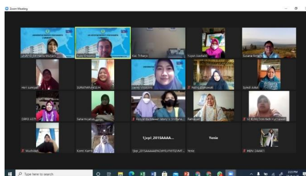
Gambar 8. Pelaksanaan Pelatihan Pemanfaatan Aplikasi Secara Daring

Setelah finalisasi uji coba aplikasi SIKIA, tim pengabdian melaksanakan kegiatan pelatihan secara bertahap mengenai pelatihan pemanfaatan aplikasi SIKIA secara daring pada pertengahan bulan Juli 2021 dan pelatihan secara luring pada bulan Oktober 2021, seperti terlihat pada Gambar 8 dan Gambar 9.