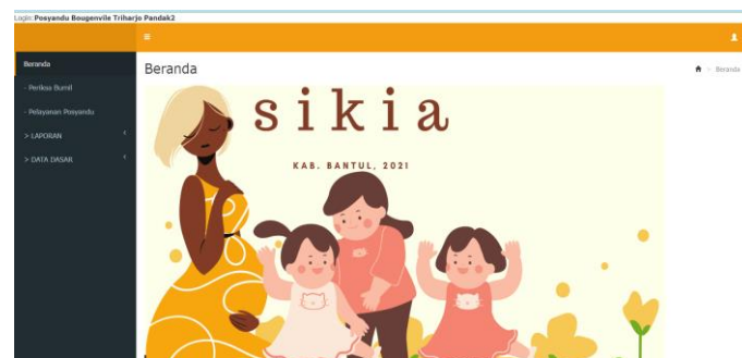
Gambar 3. Tampilan Fitur Layanan Aplikasi SIKIA

Pengembangan aplikasi SIKIA ini dilakukan oleh tim pengabdian yang memiliki kepakaran dalam bidang teknologi informasi yang melibatkan tim dan mahasiswa dari Universitas Respati Yogyakarta. Layanan yang terdapat dalam aplikasi SIKIA yakni layanan pendataan data dasar bayi yang merupakan data-data penting dalam pemantauan kesehatan balita, layanan pendataan dasar kesehatan ibu hamil, dan layanan pendataan kegiatan posyandu balita maupun ibu hamil. berikut ini adalah gambaran layanan pada aplikasi SIKIA, seperti terlihat pada Gambar 3.