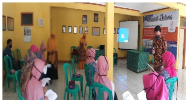
Gambar 1. Pengisian Kuesioner Pre-test

Pada hari sabtu, tanggal 26 November, telah dilakukan pertemuan dengan sekitar 18 kader posyandu di RW.02, Kelurahan Cipamokolan, Kecamatan Rancasari, Kota Bandung. Dalam pertemuan dibahas tentang teknis pelaksanaan kegiatan peningkatan pengetahuan kader posyandu dalam mencegah stunting melalui edukasi berbasis media pada masa pandemi COVID-19.