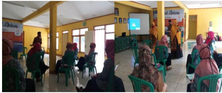
Gambar 2. Penyampaian materi tentang pencegahan stunting dan Pembagian leaflet tentang pencegahan stunting

Gambar 2 (kiri) menunjukkan tentang pemberian pendidikan kesehatan tentang stunting kepada semua kader yang hadir yaitu sebanyak 18 kader. Pemberian pendidikan kesehatan ini dilakukan untuk memberikan pemahaman kepada kader akan pentingnya melakukan pencegahan stunting sejak dini. Penjelasan yang diberikan berupa apa itu stunting, ciri-ciri jika anak mengalami stunting, penyebab terjadinya stunting dan bagaimana upaya pencegahan stunting yang dapat dilakukan. Setelah pemberian pendidikan tentang stunting kemudian dilanjutkan dengan diskusi. Gambar 2 (kanan) menjelaskan bahwa setelah kegiatan diskusi dilakukan kemudian dilanjutkan dengan pemberian leaflet kepada semua kader posyandu yang tujuannya bisa menjadi acuan bagi kader dalam upaya mencegah terjadinya stunting pada anak. Setelah dilakukan kegiatan tersebut kemudian dilakukan pengukuran (post-test) pengetahuan kepada seluruh kader posyandu.