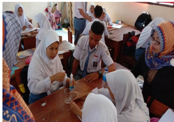
Gambar 1. Proses Belajar Mengajar dengan model PjBL berbasis STEM

Berdasarkan tabel siklus 1 dan siklus 2 tersebut pada rangkaian proses penelitian dengan menggunakan penerapan model PBL berpendekatan STEM adalah meningkatkan hasil belajar siswa. penelitian tindakan kelas ini berlangsung selama 2 kali siklus untuk menjawab rumusan masalah dalam penelitian ini. Dimana pada siklus II dikatakan tuntas sesuai syarat ketentuan yaitu mencapai 70% siswa mencapai KKM dengan jumlah siswa 27 orang dan proses pembelajaran dengan menggunakan model Discovery PjBL berbasis STEM tidak harus dilanjutkan ke siklus berikutnya.