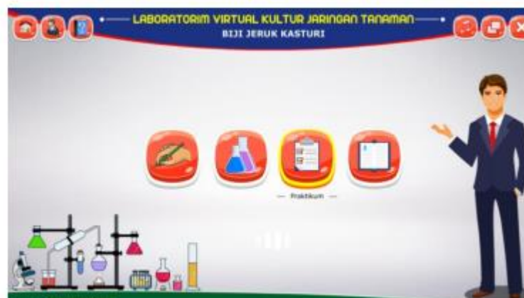
Gambar 3. Icon Menu (Tools) Pada Tampilan Awal

dibutuhkan dorongan atau dukungan dari stake holder di ranah pendidikan mahasiswa yaitu dalam lingkungan kampus dan lingkungan pendukung lainnya. Berdasarkan pada hasil penelitian self efficacy ini maka peneliti juga merancang sebuah tahapan pengembangan sumber belajar berupa media laboratorium yang berbasis virtual sebagai tindak lanjut. Sebagaimana dikatakan pada penelitian Wahono et al. (2018), Praktikum di laboratorium khususnya pada materi bioteknologi sebenarnya sangat dibutuhkan sebab cakupan ilmunya bersifat abstrak, multidisipliner, ilmiah, sosiologis dan aplikatif. Namun melakukan praktikum pada laboratorium real sering kali memiliki beberapa kendala diantaranya, ketersediaan ruangan yang kurang memadai hingga pada alat dan bahan praktikum yang sulit didapatkan terlebih pada saat pandemi virus yang harus membatasi interaksi aktivitas manusia, praktikum menjadi semakin sulit untuk dilakukan Atas dasar pertimbangan tersebut dan guna meningkatkan self efficacy mahasiswa dalam pemanfaatan teknologi dalam pembelajaran mandiri peneliti membuat sebuah design sumber belajar berupa virtual laboratorium pada mata kuliah bioteknologi khususnya materi kultur jaringan yang didasarkan pada hasil analisis kebutuhan ketersediaan sumber belajar mahasiswa yang terdapat di Pekanbaru Riau. Adapun design virtual lab yang dirancang dapat dilihat pada gambar 3 dan 4.