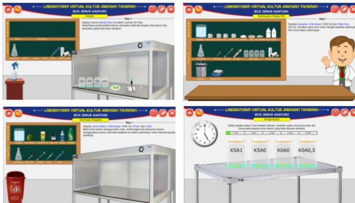
Gambar 4. Story Board Tahapan Praktikum Kultur Jaringan

Dilihat dari perspektif keyakinan dalam menyelesaikan tugas.