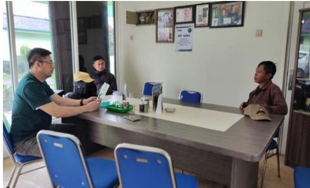
Gambar 7. Diskusi dengan perwakilan masyarakat sekitar

Pada kegiatan ini dilakukan diskusi dengan perangkat desa wisata Laksana dan beberapa organisasi swadaya masyarakat di desa tersebut. Pembahasan dimulai dengan peluang paket wisata yang akan di sosialisasikan melalui web dan media sosial lainnya. Selain itu diskusi juga diisi dengan sesi mendengarkan keinginan masyarakat terkait bagaimana situs wisata pada desa laksanakan nantinya. Diskusi dengan perangkat desa seperti terlihat pada Gambar 2.