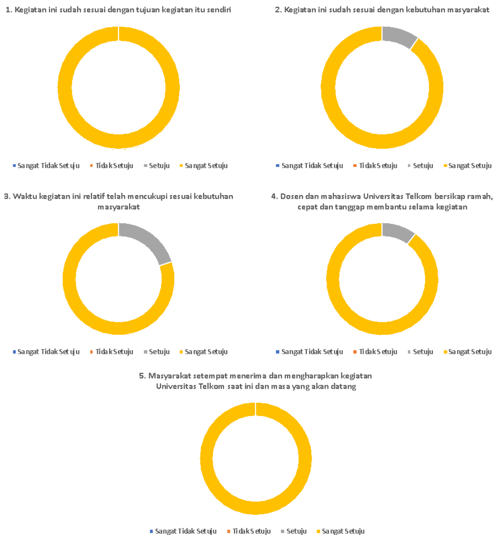
Gambar 9. Hasil feedback mitra terhadap pelaksanaan kegiatan

Dari jawaban responden, didapati 20 responden menyatakan kegiatan ini sesuai dengan tujuan dan berharap program ini terus berlanjut ditahun berikutnya. Dengan kata lain 100% responden menginginkan program ini berlanjut karena sesuai dengan tujuan yang disampaikan diawal program. Dan masyarakat juga berharap program ini berlanjut untuk sampai diimplementasikan dan memberikan dampak yang signifikan terhadap perekonomian masyarakat. Hal ini didiasari beberapa faktor yaitu, kegiatan yang sesuai dengan tujuan dan tepat sasaran terhadap permasalahan masyarakat sasar. Berbeda dengan pertanyaan 1 dan 5, pada pertanyaan ke 3 masyarakat masih merasa kurang puas dengan waktu kegiatan yang sangat pendek. Dari 20 responden 16 responden (80% responden) menjawab sangat setuju dan sisanya hanya setuju. Hal ini dikarenakan kegiatan ini berlangsung pada tahun pandemi mengakibatkan masyarakat kurang sedikit puas mengenai waktu yang disediakan untuk kegiatan ini. Kemudian pada pertanyaan ke-4, 18 responden dari total responden (90% responden ) menyatakan sangat setuju