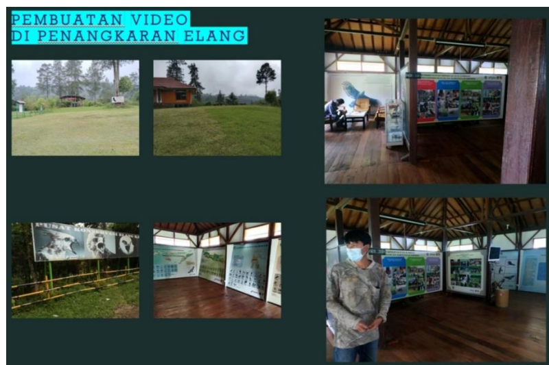
Gambar 3. Pengambilan gambar area konservasi elang

Dari survei ini bersamaan koordinasi secara tidak langsung dengan perangkat desa dilihlah beberapa lokasi yang akan dijadikan konten utama untuk dipromosikan, yaitu sentra pengolahan kopi, perkebunan kopi, roasting kopi, unit usah kopi, penangkaran elang, serta ke kawah asap yang kamojang. Beberapa objek wisata ini yang dijadikan menjadi beberapa paket untuk di promosikan ke wisatawan. Beberapa objek paket wisata seperti terlihat pada Gambar 3.