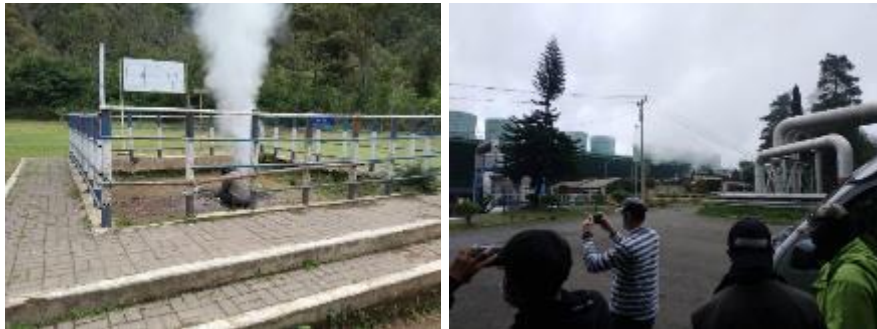
Gambar 2. Dokumentasi survei tim di lapangan

dijadikan sebagai konten yang akan dipublikasi sebagai paket digital. Dari kegiatan survei ini beberapa spot yang diamati adalah area kawah uap, penangkaran elang dan sentra pengolahan kopi. Berikut adalah dokumentasi ketika survei seperti terlihat pada Gambar 2.