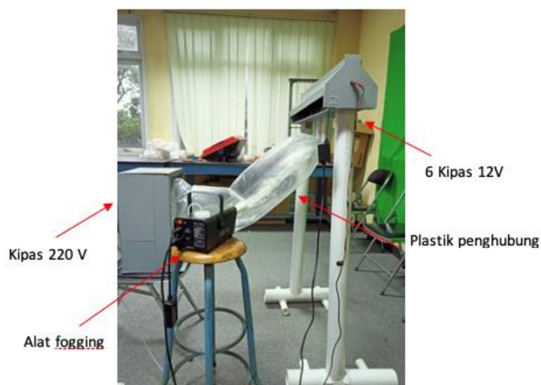
Gambar 6. Penampakan prototipe proyektor fog screen yang dibuat

Prinsip kerja dari alat ini adalah dengan meniupkan asap pekat ke dalam sebuah media yang cukup lebar dengan lubang di atasnya yang memiliki interval jarak yang sama. Semburan asap didorong dengan menggunakan blower bertekanan tinggi sehingga memungkinkan asap dapat menyebar dan membuat sebuah media pantul bagi proyektor. Semburan asap dengan tekanan tinggi ini mendemonstrasikan semburan uap di kawah kereta api kawasan Kamojang yang merupakan kawah dengan tekanan tinggi dan asap pekat yang nantinya akan dijadikan lokasi penempatan dari media ini. Penampakan prototipe yang dibuat seperti terlihat pada Gambar 6.