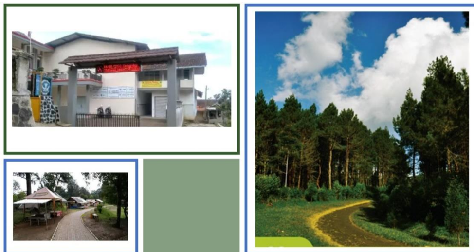
Gambar 1. Kondisi terkini desa Laksana