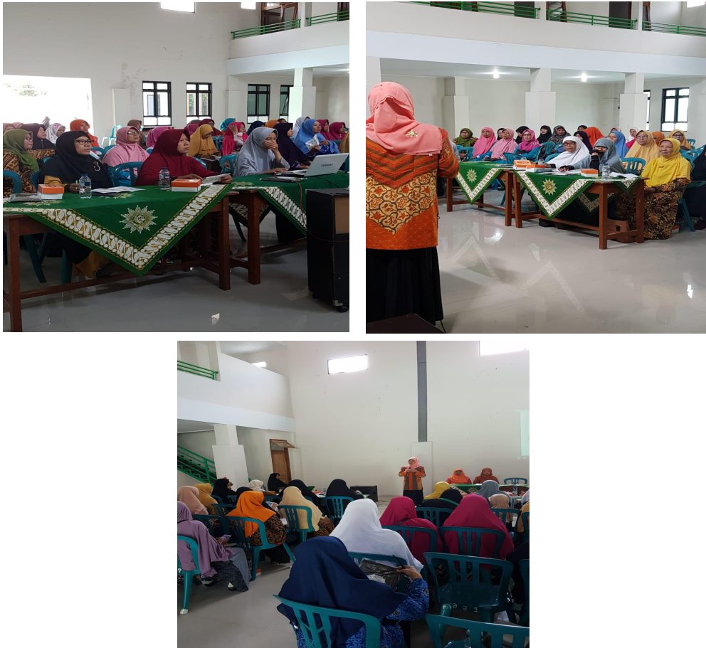
Gambar 1, 2, 3. Edukasi pemeriksaan ginekologi

Pada Gambar 1, 2, dan 3 tampak bahwa ibu-ibu peserta pengabdian edukasi pemeriksaan ginekologi bagi cerdas berkeselamatan reproduksi antusias mengikuti informasi apa dan bagaimana cara pemeriksaan ginekologi. Pemeriksaan ginekologi akan memberikan informasi tentang apa saja dari kesehatan reproduksi para peserta mengenai vagina dan serviks mereka.