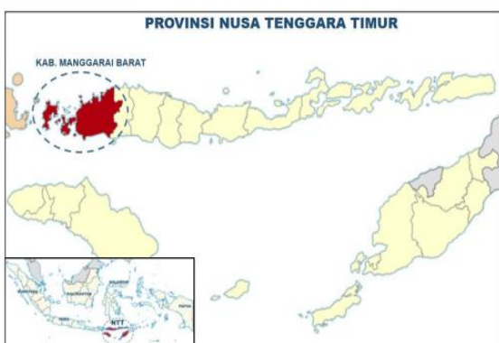
Gambar 2. Peta Provinsi NTT

Nusa Tenggara Timur adalah suatu wilayah yang dikenal istilah Flobamorata , yang memiliki makna kumpulan 5 pulau besar yaitu Flores, Sumba, Timor, Alor dan Lembata. Provinsi ini memiliki luas wilayah berupa daratan seluas 47.931,54 km 2 .