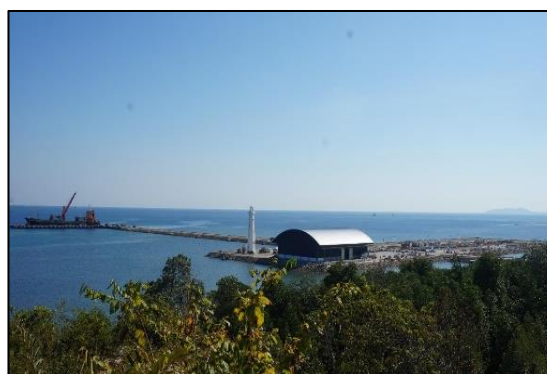
Gambar 3. Foto Terminal Multipurpose Wae Kelambu