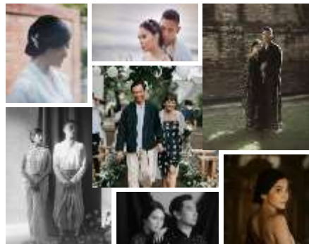
Gambar 1. Kolase styling pakaian pengantin etnik 2021

Pengantin di tahun ini cukup banyak menggunakan personal styling pada pakaian pernikahannya terutama pada pakaian sesi resepsi. Tren yang terjadi pada masyarakat saat ini adalah menggunakan unsur etnik pada pernikahannya. Unsur etnik yang digunakan merupakan kombinasi dengan unsur modern misalnya memadukan antara kain motif etnik atau kain lokal dengan perhiasan modern dengan pola pakaian yang bebas menyesuaikan selera dari pengantin.