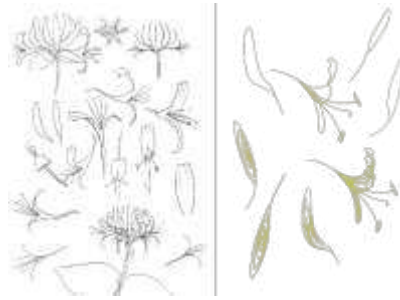
Gambar 3. pencarian modul melalui pendekatan stilasi