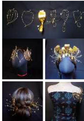
Gambar 4. Hasil Pengembangan Modul melalui pendekatan design by doing

Hasil dari pengembangan modul kemudian dianalisis lebih lanjut dan dipilih sesuai dengan kriteria dan batasan desain untuk dikembangkan secara lebih detail untuk rencana prototipe akhir. Kriteria pertimbangan pemilihan desain alternatif terpilih diantaranya adalah tipe perhiasan harus standout , mudah digunakan, ukuran yang adjustable . Dengan pertimbangan kriteria tersebut, perhiasan dibagian kepala merupakan tepat dilakukan sebagai pusat perhatian.