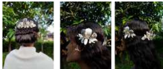
Gambar 7. Hasil mockup

Hasil dari proses desain kemudian dilanjutkan ke proses mockup . Mockup dilakukan dengan bahan yang mendekati bahan asil dari perhiasan, dilakukan untuk memastikan ukuran dan tampilan sehingga mengurangi resiko adanya kesalahan ketika produk dibuat dengan material dan ukuran sebenarnya. Setelah mockup dilakukan, lalu dibuat prototipe dengan material sesungguhnya yaitu logam kuningan dan bahan pelengkap lainnya.