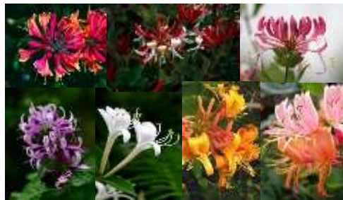
Gambar 2. Image Board Bunga Kamperfuli

Inspirasi bentuk yang digunakan adalah bunga Kamperfuli. Bunga Kamperfuli, dalam bahasa Inggris Honeysuckle atau bahasa Latin lonicera merupakan tanaman perdu yang bersifat merambat dan terkenal karena harum yang dihasilkan dari bunganya. Tanaman ini juga terkenal sebagai penghasil nektar bagi serangga dan hummingbird . Bunga kamperfuli memiliki makna sebagai devotion , attachment , faith , dan fidelity selain itu juga bermakna affection dan sweetness [4]. Makna tersebut sejalan dengan makna dari pernikahan yaitu komitmen dan kasih sayang. Serta pada beberapa daerah dipercaya sebagai pencegah nasib buruk [5]. Di Indonesia sendiri bunga ini digunakan sebagai salah satu ramuan untuk obat.