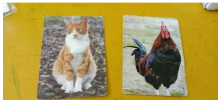
Gambar. 3 Bagian belakang Flashcard