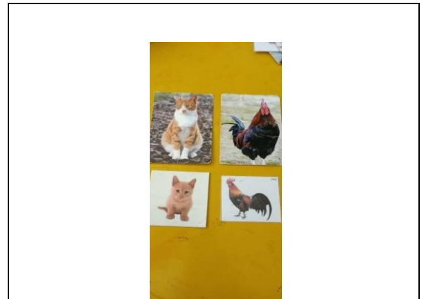
Gambar. 4 Flalshcard berisi cerita bersambung