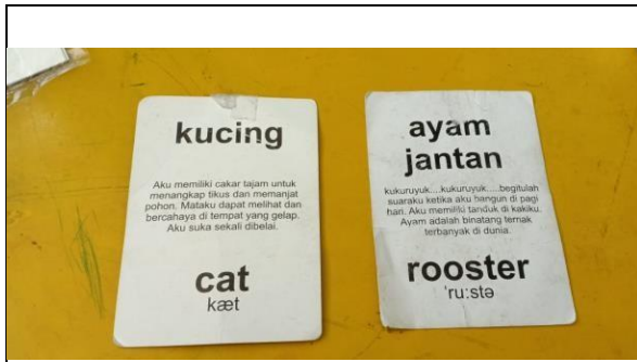
Gambar. 2 Variasi gambar Flashcard