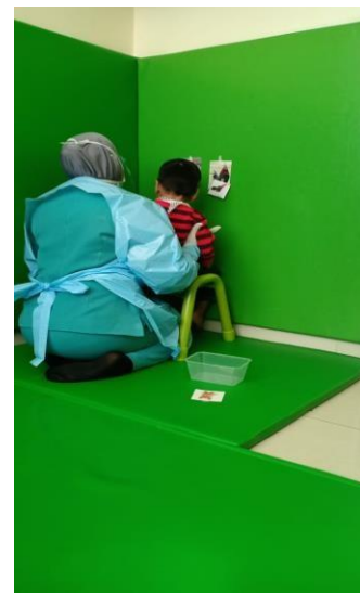
Gambar 5 Proses Terapi

Terapis menggabungkan komunikasi terapeutik non verbal dan verbal secara bersamaan untuk dapat mengontrol agresifitas anak dan membuatnya tetap fokus pada proses terapi. Anak juga diberi pijatan massage di sekitar mulut dan juga diberi Pelukan hangat oleh Terapis khususnya ketika anak memberontak. Gunanya untuk membuat anak lebih tenang.