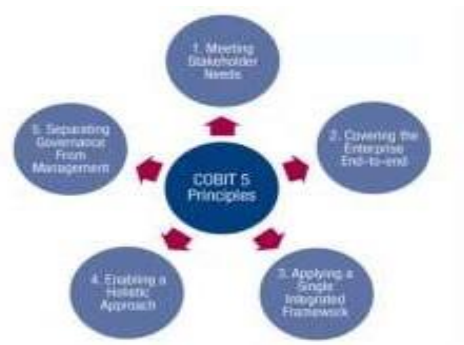
Gambar 2. Area Kunci Tata Kelola dan Manajemen COBIT 5 (ISACA, 2012)

Proses pada COBIT 5 terdiri dari dua proses yaitu proses tata kelola dan proses manajemen.