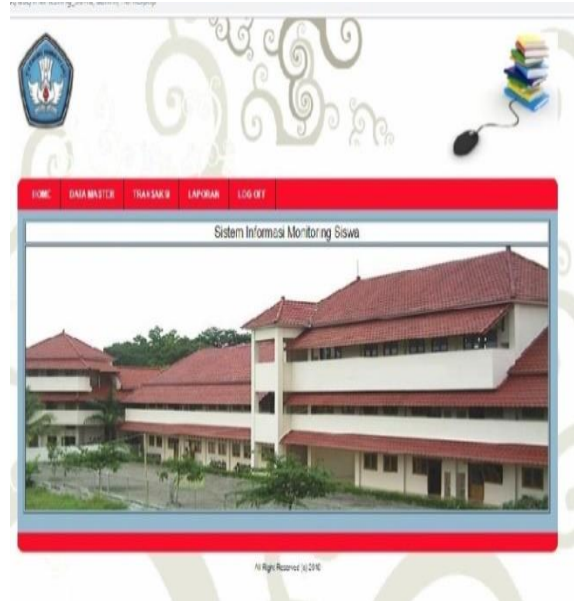
Gambar 4.1 Tampilan Menu Utama

Adapaun fitur-fitur pada aplikasi ini adalah sebagai berikut : Menu Utama terdiri dari sub menu master, transaksi, laporan dan log out. Tampilan menu utama dapat dilihat pada Gambar 4.1 berikut ini :