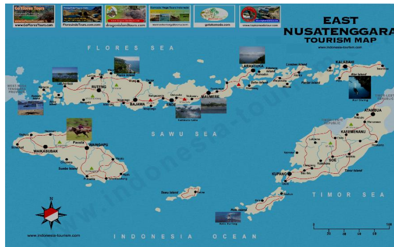
Gambar 2 Peta Pariwisata Provinsi Nusa Tenggara Timur

Keenam sektor unggulan tersebut adalah Pangan, Maritim, Pariwisata, Industri, Energi dan Infrastruktur. Target yang ditetapkan pemerintah untuk sektor pariwisata di Tahun 2019 adalah peningkatan jumlah kunjungan wisatawan mancanegara (wisman) yaitu sebanyak 20 juta wisatawan, dan 275 juta wisatawan nusantara (wisnus), serta peringkat 30 tourism and competitive index . Salah satu provinsi yang menjadi perhatian pemerintah pusat dalam pengembangan pariwisata adalah Provinsi Nusa Tenggara Timur (NTT). Provinsi NTT merupakan salah satu provinsi kepulauan di Indonesia yang wilayahnya disatukan oleh Laut Sawu dan Selat Sumba, dengan jumlah pulau 1.192 (pulau besar dan kecil), yang memiliki kekayaan alam dan kekayaan budaya yang cukup potensial untuk dikembangkan menjadi destinasi pariwisata yang potensial yang tersebar hampir di semua pulau di NTT (Gambar 2).