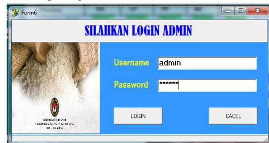
Gambar 1. Form Login

Tampilan menu login merupakan form yang digunakan untuk memasukkan username dan password sesuai hak akses dengan tujuan agar program tersebut dapat dibuka seperti yang terlihat pada gambar 1 berikut ini :