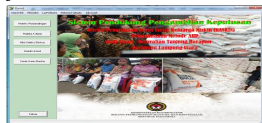
Gambar 2. Form Menu Utama Program

Tampilan menu utama merupakan tampilan utama program yang dirancang penulis pada halaman utamanya seperti yang terlihat pada gambar 2 berikut ini :