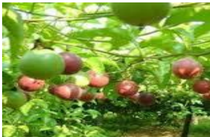
Gambar 1. Tanaman Menjalar Buah Markisa

Analisis organoleptis produk meliputi tekstur, warna, aroma dan rasa, biasa dilakukan dengan manusia sebagai obyek atau panelis. Tekstur dan konstituen produk mempengaruhi rasa produk. Perubahan tekstur dan viskositas mengubah rasa dan aroma, karena berpengaruh terhadap kecepatan munculnya rasa pada sel reseptor rasa dan kelenjar liur. Semakin kental produk maka intensitas rasa dan bau semakin sulit diterima. Peningkatan ransangan rasa manis dan turunnya rasa asin dan pahit dipengaruhi kenaikan temperatur. Umumnya, buah yang digunakan menjadi tolok ukur aroma sirup sebagai hasil produksi. Buah memiliki kandungan zat volatil yang menimbulkan aroma khas buah segar tersebut. Cita rasa manis yang ditimbulkan dari gula, rasa asam dapat ditimbulkan dari buahnya (6,16,17).