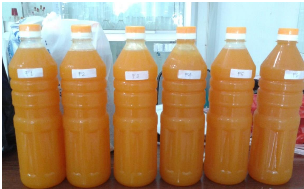
Gambar 3. Sediaan Sirup Markisa Berastagi dengan Konsentrasi Stabilisator Berbeda.

Proses pembuatan sirup markisa diawali dari konsentrasi Agar-Agar yang paling rendah sampai tertinggi dengan konsentrasi CMC sebaliknya. Formulasi S1 – S4 tidak ada permasalahan. Namun formulasi S5 – S6, larutan sediaan sirup yang dihasilkan sangat kental sehingga sukar disaring, maka penyaringan sediaan dalam keadaan panas.