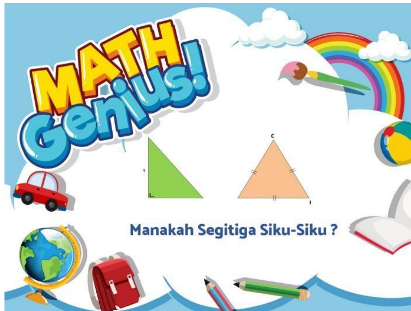
Gambar 3. Tampilan Soal Tebak Gambar

Setelah perintah MULAI diklik akan muncul halaman soal seperti gambar 3. Pada halaman ini berisi soal-soal tebak gambar yang akan ditanyakan kepada user. Mulai dari soal pertama hingga soal akhir.