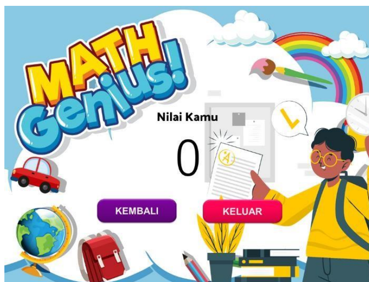
Gambar 6. Implementasi Menu Nilai Kamu

Nilai akan muncul berdasarkan poin yang telah diperoleh dalam game tersebut mulai dari 10 s/d 100.