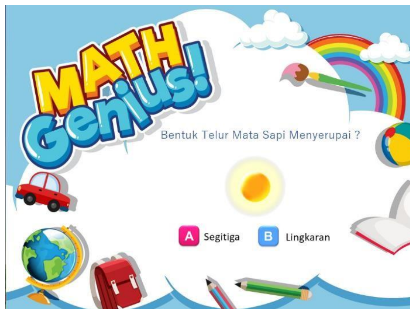
Gambar 4. Tampilan Soal Lainnya.

Pada tampilan permainan ini pemain akan diberi pertanyaan berdasarkan materi-materi yang disediakan secara random. Untuk menjawab satu pertanyaan dengan benar pemain hanya dapat mengklik pada gambar yang berada pada tampilan.