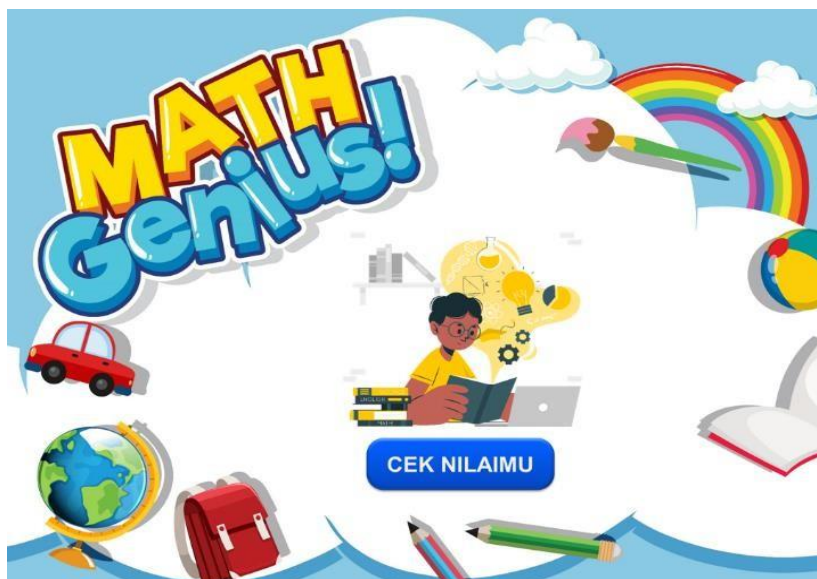
Gambar 5. Tampilan Soal Lainnya.

Nilai akan muncul berdasarkan poin yang telah diperoleh dalam game tersebut mulai dari 10 s/d 100.