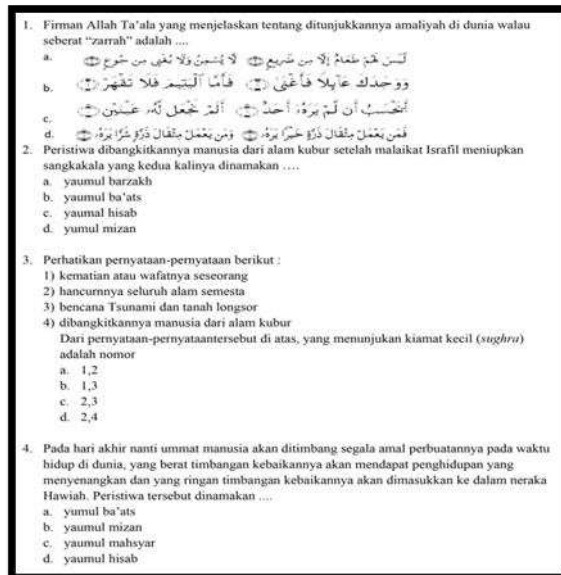
Gambar 2. Contoh soal yang dibuat oleh guru 3

Dari gambar tersebut maka dapat kita bandingkan antara guru yang satu dan yang lainnya. Khususnya dalam pembuatan soal pada mata pelajaran PAI. dan secara nyata, guru memang belum mengkolaborasi delapan model yang tersedia di dalam bentuk penyajian soal multiple choice .