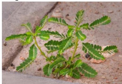
Gambar 1. Phyllanthus niruri (Meniran) (Kamruzzaman and Hoq, 2016)

Meniran merupakan herba yang berasal dari genus Phyllanthus dengan nama ilmiah Phyllanthus niruri Linn. Tumbuhan ini mengandung beberapa konstituen fitokimia seperti alkaloid dan fenol yang tinggi, flavonoid, terpenoid, steroid, cardiac glycosides , saponin, tanin, glikosida dan sianogenik. Analisis menunjukkan bahwa P. niruri mengandung kandungan karbohidrat dan serat yang tinggi. Beberapa senyawa kimia yang penting diisolasi dari Phyllanthus niruri seperti phyllanthin , hypophyllanthin , niranthin , nirtetralin , phyltetralin , phyllangin , nirphilin , phyllnirurin dan corilagin . Senyawa ini bertanggung jawab atas beberapa kegiatan farmakologis. Tanaman P. niruri ini mengandung saponin dan tanin dengan tingkat tinggi dan glikosida sianogen yang rendah (Danladi et al. , 2018).