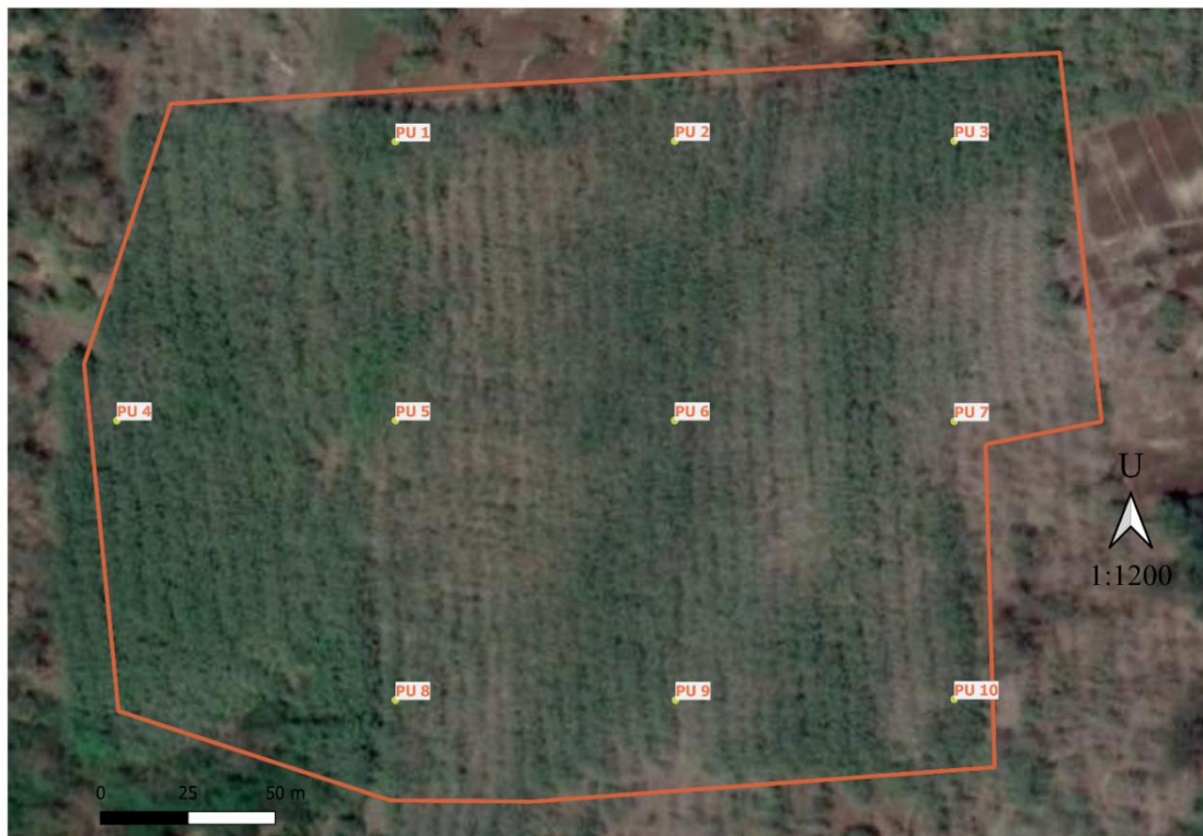
Gambar 3. Distribusi petak ukur di tegakan jati mega.