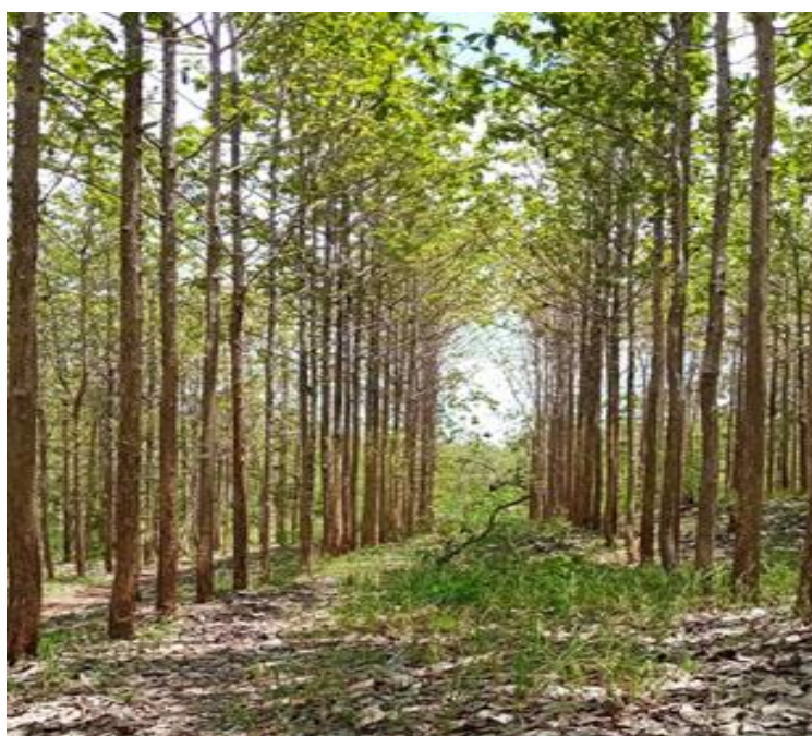
Gambar 1. Tegakan jati mega di KHDTK Wanagama.

Penelitian dilaksanakan di Kawasan Hutan Dengan Tujuan Khusus (KHDTK) Wanagama. Secara geografis Hutan Pendidikan Wanagama terletak antara 75°3'25" dan 110°33'3" Bujur Timur dan antara 7°53'25" dan 7°54'52" Lintang Selatan. Wanagama terbagi menjadi 8 petak yang membujur dari barat ke timur terdiri dari petak 5, 6, 7, 13, 14, 16, 17, dan 18. Wanagama secara administratif terletak dalam wilayah Kecamatan Playen dan Patuk Gunungkidul. Penelitian kali ini dilakukan di Tegakan Jati Mega (Gambar 1) yang terletak di Petak 13 KHDTK Wanagama (Gambar 2).