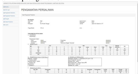
Gambar 5. Tampilan Pengamatan Persalinan

Dalam halaman input pengamatan persalinan bidan desa bisa memasukkan data saat pasien akan melakukan persalinan dan setelah persalinan. Tampilan menu input data pengamatan persalinan terlihat pada gambar 5.