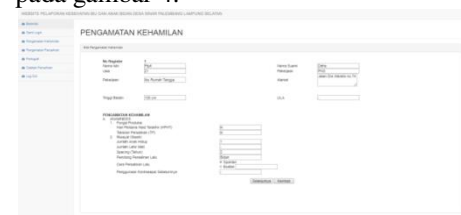
Gambar 4. Tampilan Menu Pengamatan Kehamilan

Dalam halaman input pengamatan kehamilan bidan desa bisa memasukkan data saat pemeriksaan berlangsung. Tampilan menu pengamatan terlihat pada gambar 4.