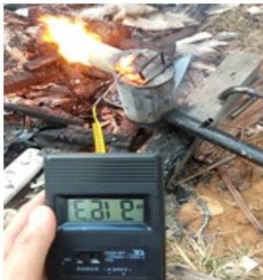
Gambar 2. Pengukuran temperatur tungku burner

pengujian dilakukan selama 45 menit menggunakan alat ukur thermometer digital TM-902C dengan meletakkan ujung sensor probe thermometer ke dalam tungku. Pengukuran tungku burner pada Gambar 2, dibawah ini :