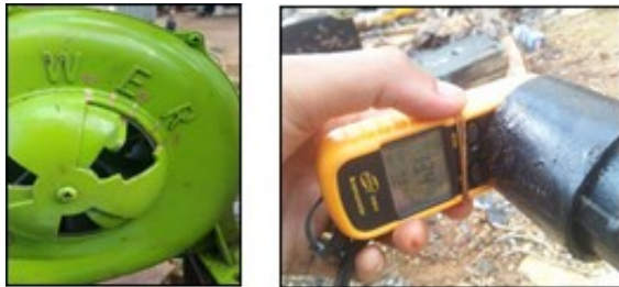
Gambar 1. Pengukuran kecepatan udara

Pada penelitian kali ini metode yang digunakan ialah metode dengan eksperimen langsung bahan yang digunakan tungku burner menggunakan blower listrik dan ruang pembakaran incinerator untuk pengambilan data laju aliran massa udara menggunakan alat ukur anemometer diletakkan diujung pipa output dari blower listrik yang ditunjukkan pada Gambar 1. untuk mencari kecepatan udara terlebih dahulu.