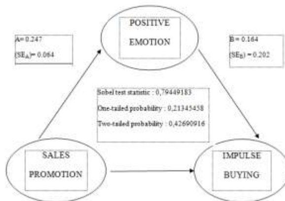
Gambar 2 Hasil Uji Sobel Test 1

Berdasarkan hasil perhitungan sobel diatas dapat diambil kesimpulan bahwa positive emotion tidak bisa menjadi variabel intervening antara sales promotion dan store atmosphere . Dari perhitungan sobel diatas dapat disimpulkan sales promotion berpengaruh terhadap impulse buying melalui positive emotion “Ditolak”.