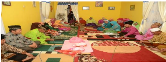
Gambar 1 Suasana Pelaksanaan Tolobalango

menandakan bahwa pihak laki-laki siap menyediakan pakaian pengantin dengan perlengkapannya. Jika pinang yang mereka bawa berisi tumpukan itu bermakna bahwa pihak laki-laki siap memberikan sedekah kepada tokoh masyarakat dan juga pemangku adat yang pada saat itu menghadiri upacara pernikahan. Penyerahan simbol-simbol adat ini diberikan seiring dengan proses peminangan di upacara tolobalango , jika simbol-simbol adat tersebut diterima, maka mengilustrasikan bahwa lamaran dari pihak laki-laki pun telah diterima oleh pihak perempuan secara adat. Proses penyerahan simbol-simbol adat itu dilaksanakan dengan cara saling berbalas tujai (pantun) antara pemangku adat perwakilan pihak laki-laki dengan pemangku adat perwakilan dari pihak perempuan. Kondisi tersebut dapat dilihat pada foto berikut ini: