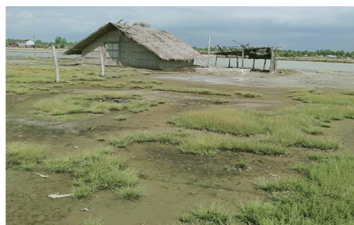
Gambar 2. Kondisi tanah untuk lahan garam geomembran