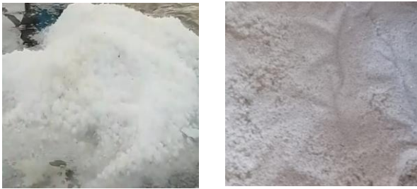
(a) Garam geomembran (b) Garam tradisional Gambar 6. Perbandingan warna garam.

geomembran dengan produk garam tradisional dapat dilihat pada Gambar 6.