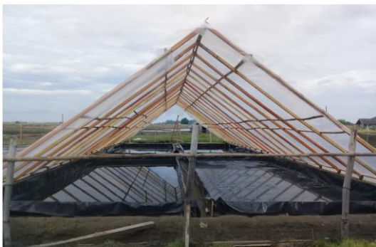
Gambar 1. Meja kristalisasi garam geomembran HDPE 2 mm model lorong ( tunnel )

Kegiatan dilanjutkan dengan pembuatan meja kristalisasi garam geomembran model lorong ( tunnel ) dengan ukuran L 4,2 x P 20 x T 0,2 mtr. Adapun bentuk dari meja kristalisasi tersebut dapat dilihat pada Gambar 1. Meja kristalisasi garam di isi dengan air garam tua (sekitar 25° baume) dan diuapkan menggunakan sinar matahari selama 8-10 hari (tergantung cuaca) hingga air garam tua berubah menjadi kristal garam berwarna putih. Produk garam diambil untuk dilakukan pengujian produk sesuai dengan persyaratan mutu SNI. Sebagai bahan pembandingan juga dilakukan pengambilan data produksi garam tradisional menggunakan penguapan dengan panas dari pembakaran kayu bakar dilakukan dengan cara wawancara langsung ke petani garam tradisional, juga dengan mengambil sampel garam tradisional dan dilakukan pengujian sesuai dengan persyaratan mutu SNI. Hasil dari penelitian diolah dan ditampilkan dalam bentuk Tabel serta Gambar.