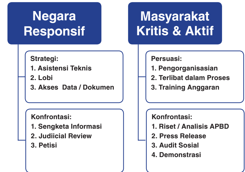
Diagram 3. Strategi Advokasi PPRG

Demonstrasi dilakukan untuk menyikapi sebuah kebijakan yang tidak memihak kepada kelompok perempuan, masyarakat miskin dan marginal lainnya serta untuk mengungkap kasus-kasus ketidakadilan yang dialami oleh mereka.