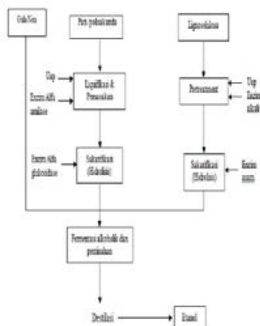
Gambar. Diagram alir proses pembuatan bioetanol

Menurut Sastrohamidjojo (2009), dan Gaman dan Sherrington (1994). Polisakarida merupakan hasil penggabungan atau polimer hasil