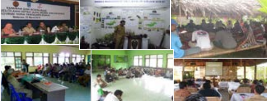
Pertemuan, sosialisasi, dan fasilitasi kepada pihak terkait guna penanganan resolusi konflik

Upaya penanganan konflik pada tingkat eskalasi tinggi (kasus desa Rempek) dilakukan secara kolaboratif dengan langkah-langkah antara lain; (a) identifikasi analisis konflik; (b) koordinasi dengan para pihak; (c) penunjukkan dan pemberian tugas kepada petugas lapangan; (d) pembentukan tokoh kunci; (e) sosialisasi program secara intensif; (f) penentuan pusat kegiatan (home base); (g) membangun jejaring kolaborasi program; (h) secara simultan melakukan ujicoba reboisasi hutan; (i) membentuk Tim 9; (j) membentuk koperasi; (k) menggulirkan isu kesejahteraan melalui program kemitraan kehutanan; (l) membudayakan pertemuan rutin; dan (m) menyusun peta perjalanan (road map) kelompok ke depan.