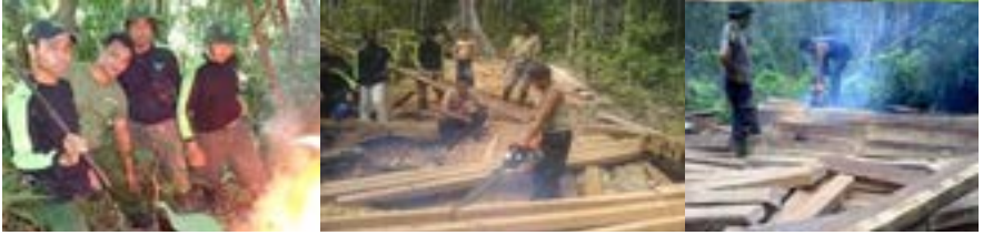
Kegiatan Pengamanan Hutan KPH Rinjani Barat