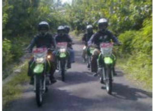
Brigade Trail KPH

Margasatwa menjadi Taman Nasional seluas 41.330 Ha; (g). Penunjukan Menhutbun No.: 244/Kpts-II/1999 perubahan sebagian hutan lindung menjadi Tahura Nuraksa Sesaot seluas 3.150 Ha; (h). Penunjukan Menhutbun No: 418/Kpts-II/1999; (i). Penunjukan Menhut No: SK.598/Menhut-II/2009; dan (j). Penetapan Menhut No. SK. 3065/Menhut-VII/2014 tanggal 23 April 2014, dengan total luas definitif 125.200 Ha.