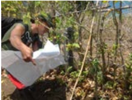
Kegiatan Rekonstruksi Batas

Letak geografis KPHL Rinjani Barat terletak antara 116^{\circ}02'44'' - 116^{\circ}28'25'' Bujur Timur dan 08^{\circ}17'22'' - 08^{\circ}34'52'' Lintang Selatan, berada pada bagian barat laut Pulau Lombok yang berbatasan dengan pemukiman penduduk serta kawasan konservasi antara lain Taman Nasional Gunung Rinjani (TNGR), TWA Kerandangan, TWA