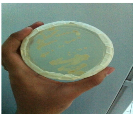
Gambar 2. Hasil isolasi bakteri Aeromonas hydrophila

Pembiakan murni bakteri Aeromonas hydrophila dilakukan dengan memindahkan isolate stok pada medium TSA dalam cawan petri dengan cara penggoresan secara zigzag. Hasil pembiakan murni selanjutnya diperiksa di Laboratorium Bakteriologi, Dinas Kesehatan Provinsi Sulawesi Utara. Hasil pemeriksaan menunjukkan bahwa bakteri ini benar adalah bakteri A hydrophila . Stok bakteri yang telah diuji ini selanjutnya disimpan dalam lemari pendingin untuk digunakan pada uji antibakteri.