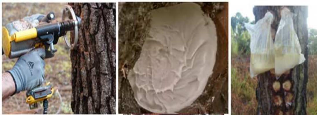
Gambar 4. Program Biogemme (Holiste, 2015) Figure 4. Biogemme program (Holiste, 2015)