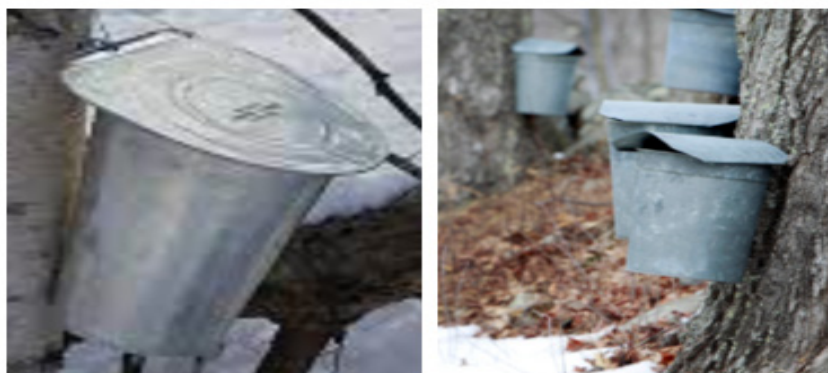
Gambar 5. Wadah dengan penutup (Vermont, 2016) Figure 5. Cup with cover (Vermont, 2016)

Strategi ini dapat dilakukan dengan cara pelatihan terkait penyadapan yang efisien, berkualitas dan lestari, pelatihan terkait pengenalan fisiologi pohon pinus, memberikan pengetahuan dasar jenis kualitas getah, diskusi rutin terkait perkembangan tentang pinus mulai stimulant hingga pemanenan getah pinus dan monitoring kinerja penyadap. Peningkatan kualitas penyadap juga dapat melalui penyebarluasan informasi dengan media leaflet dan buku panduan atau dengan cara pelatihan, studi banding, dan lainnya (Sanudin, 2009).