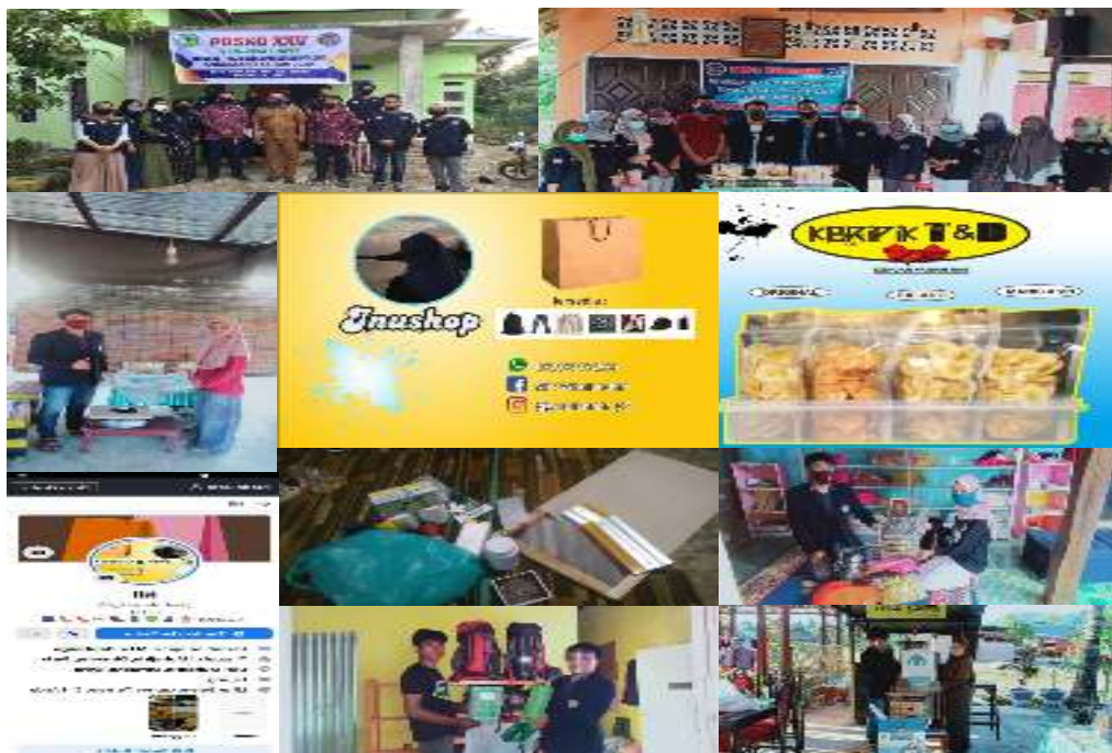
Gambar 2. Realisasi Kegiatan “Pelatihan Organisasi Kepemudaan, entrepreneurship , Ekonomi Kreatif, Bisnis Online, dan pengadaan teknologi tepat guna” KKN-PPM DIKTI UM Palopo, Posko 25 Desa Muhajirin Kecamatan Suli Barat Kabupaten Luwu