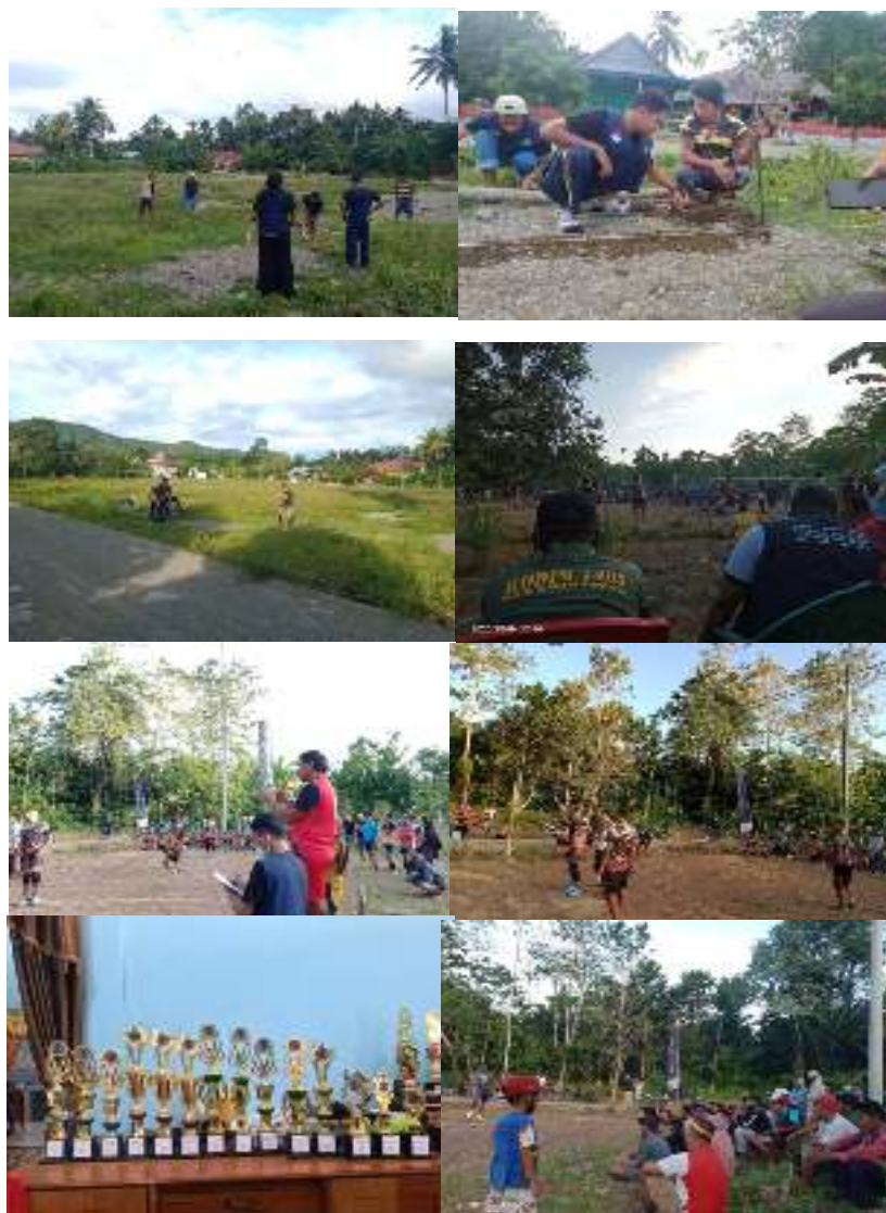
Gambar 3. Realisasi Kegiatan “Revitalisasi Sarpras Olahraga dan Event Olahraga skala kecamatan dan desa” KKN-PPM DIKTI UM Palopo, Posko 25 Desa Muhajirin Kecamatan Suli Barat Kabupaten Luwu