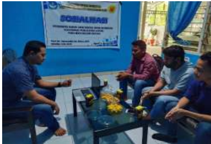
Gambar 1. Fasilitator Menyampaikan Materi Tahap Pertama

Tahap kedua, mempresentasikan materi sosialisasi dengan memperhatikan urutan logisnya dan maknanya bagi peserta. Setelah itu, pemateri mempresentasikan tugas cara penggunaan yang harus diselesaikan oleh peserta. Adapun urutan persentasi materi tersebut, (1) menjelaskan tujuan dan manfaat bahan ajar digital book , (2) menjelaskan fitur aplikasi bahan ajar, (3) fungsi atau kegunaan masing-masing fitur, dan (4) menjelaskan cara menggunakan aplikasi bahan ajar digital book berbasis electronic publication (epub) pada mata kuliah renang.