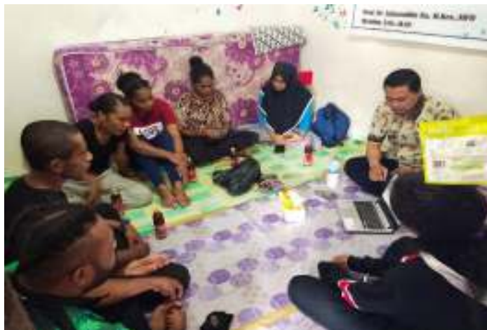
Gambar 3. Pemateri Menyampaikan Materi Tahap Ketiga

(epub) pada mata kuliah renang diterapkan oleh dosen pengampu mata kuliah renang dalam proses pembelajaran?”. Sedangkan jawaban peserta dapat dilihat pada bagian hasil dan pembahasan.