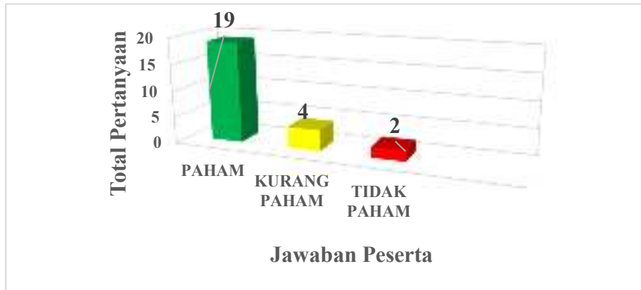
Gambar 5. Grafik Jawaban Peserta.

Pertanyaan kedua ialah “Apakah anda memahami fungsi atau kegunaan fitur aplikasi bahan ajar digital book berbasis epub setelah diberikan penjelasan?”. Adapun jawaban peserta dapat dilihat pada gambar 5 berikut.