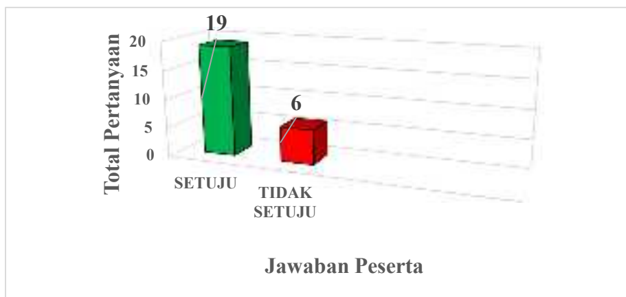
Gambar 6. Grafik Jawaban Peserta.

Pertanyaan ketiga ialah “Apakah anda setuju jika bahan ajar digital book berbasis electronic publication (epub) pada mata kuliah renang diterapkan oleh dosen pengampu mata kuliah renang dalam proses pembelajaran?”. Jawaban peserta dapat dilihat pada gambar 6 sebagai berikut.