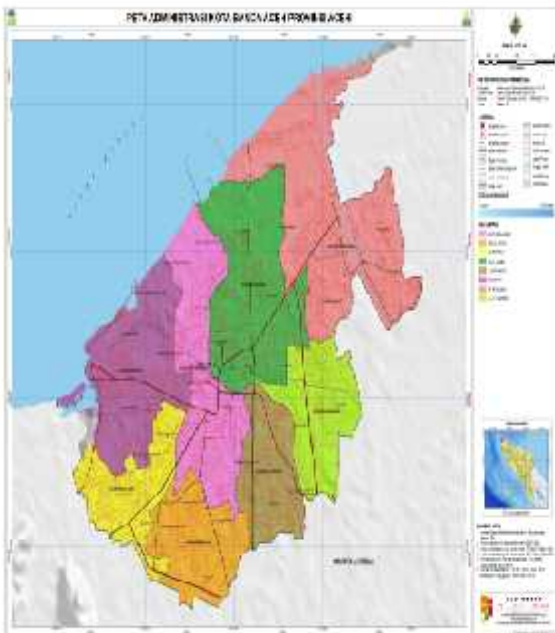
Gambar 1. Peta Administrasi Kota Banda Aceh

Letak geografis Kota Banda Aceh berada di wilayah paling barat Pulau Sumatera, dengan posisi astronomis berada pada posisi 05°16'15"- 05°36'16" lintang utara dan 95°16'15"- 95°22'35" bujur timur, dengan luas wilayah keseluruhan 61,36 km 2 dan ketinggian rata-rata 0,80 meter di atas permukaan laut (BPS, 2016). Kota Banda Aceh memiliki potensi ekonomi besar sebagai gerbang bagian barat Indonesia dan berhadapan langsung dengan Samudera Hindia. Potensi tersebut secara tidak langsung dapat menjadi aset bagi Kota Banda Aceh dalam pelaksanaan pembangunannya, khususnya dalam sektor pariwisata.