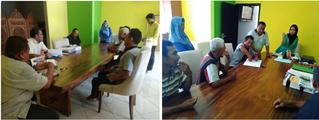
Gambar 4. Pembentukan Gapokkan Mina Muntok Mandiri dan pendaftaran badan hukum.

Kegiatan peningkatan kelas kelompok mulai dari perencanaan hingga survei dan verifikasi dilaksanakan antara 20 September – 30 Oktober 2017 (Gambar 3). Hasil verifikasi menunjukkan bahwa Pokdakan Sinar Menumbing memiliki nilai total sebesar 456 dengan rincian tiap indikator yaitu 133 pada perencanaan, 78 pada kemampuan berorganisasi, 48 pada akses kelembagaan, 116 pada kemampuan wirausaha, dan 81 pada kemandirian. Penilaian memenuhi syarat untuk menyatakan Pokdakan Sinar Menumbing layak ditingkatkan ke kelas madya (Tabel 1). Sertifikat penguatan Pokdakan kelas madya ditetapkan tanggal 26 Oktober 2017 dengan nomor sertifikat 2.1.19.05.0410.2017. Pada tahun 2018, Pokdakan Sinar Menumbing menjadi Pokdakan madya yang bergabung dengan Pokdakan-Pokdakan pemula di sekitarnya dalam naungan Gapokkan (Gabungan Kelompok Perikanan) Mina Muntok Mandiri (Gambar 4).