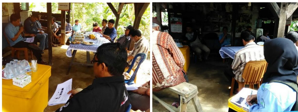
Gambar 3. Kegiatan penilaian kelas kelompok pembudidaya ikan