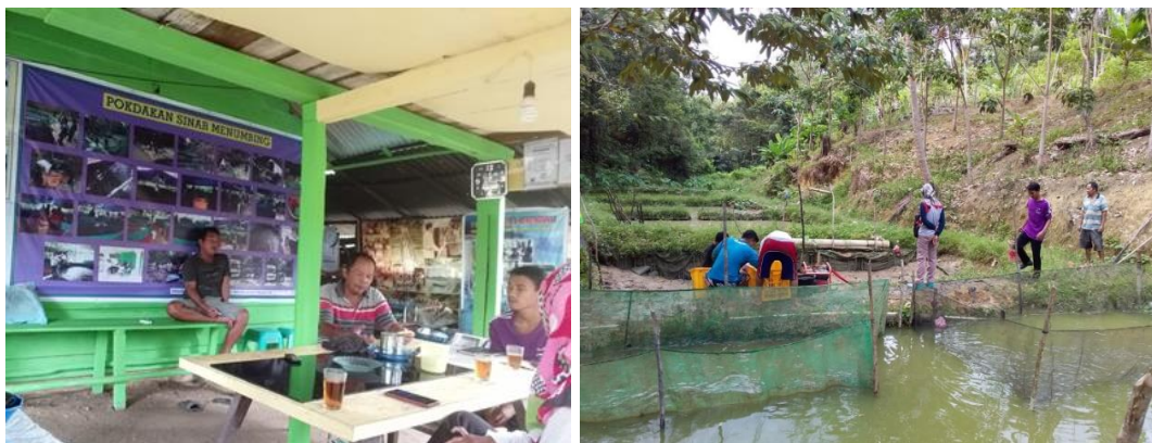
Gambar 2. Kunjungan rutin Pokdakan Sinar Menumbing oleh penyuluh perikanan.

sehingga perhatian dan pendampingan kepada kelompok lebih sering dilakukan.