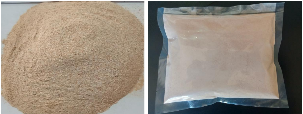
Gambar 2. Produk Tepung Kepiting

Produk tepung kepiting disajikan dalam Gambar 2.