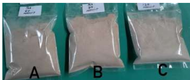
Gambar 2. Tepung Kulit Kentang.

Dalam pembuatan tepung kulit kentang, warna tepung yang dihasilkan berwarna kecoklatan. Browning dapat terjadi pada buah dan sayuran, termasuk kentang, terutama disebabkan oleh oksidasi enzimatis senyawa fenolik tertentu (mono -, di - dan polifenol) menjadi o-difenol. Selanjutnya akan menghasilkan kuinon yang menyebabkan terjadinya polimerisasi non-enzimatis dan terbentuk pigmen warna melanin atau coklat [20]. Untuk memperbaiki warna dari tepung kentang dilakukan perendaman dengan menggunakan larutan Natrium Bisulfit selama 60, 90, dan 120 menit. Natrium bisulfit memiliki kemampuan untuk mencegah reaksi browning pada tepung dengan mencegah aktifitas fenolase [20]. Warna tepung kulit kentang yang dihasilkan dapat dilihat pada Gambar 2.