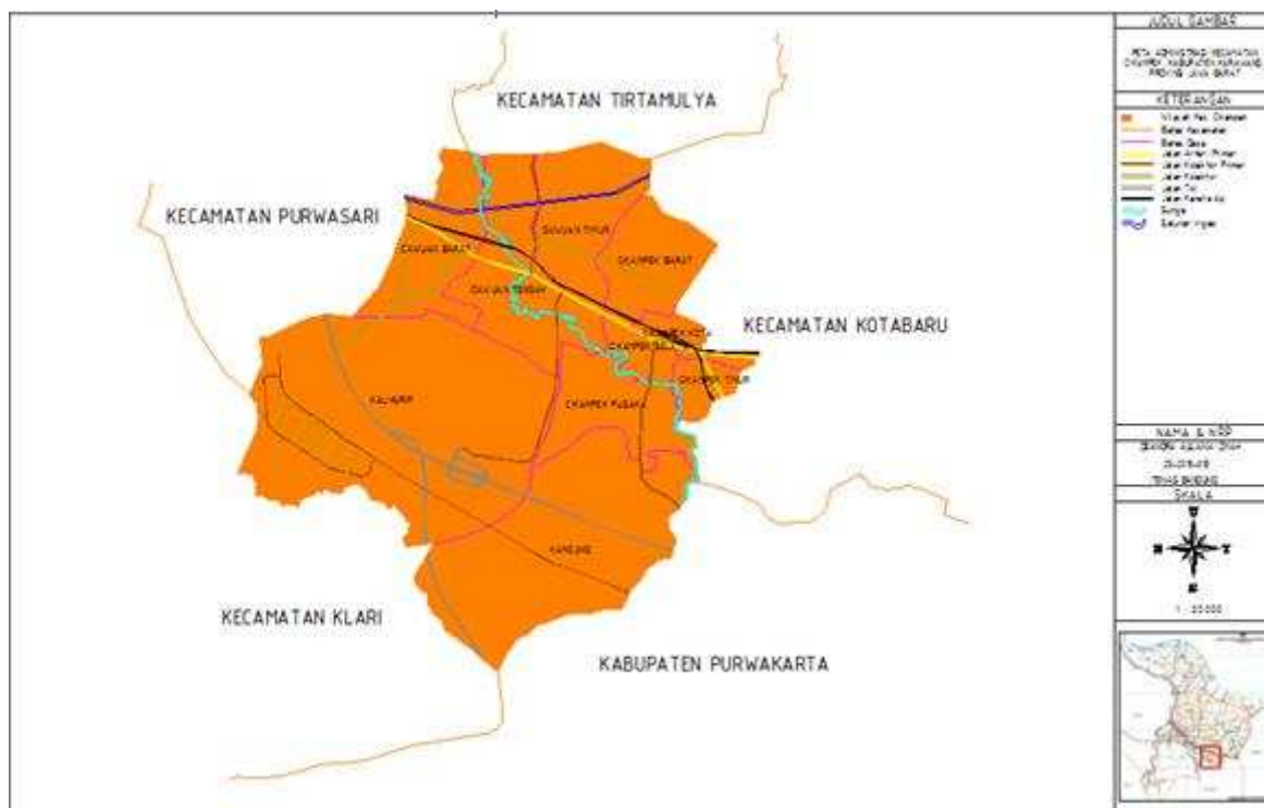
Gambar 1. Peta Administarsi Kecamatan Cikampek

Cikampek adalah sebuah kecamatan di Kabupaten Karawang, Provinsi Jawa Barat, Indonesia. Kecamatan Cikampek terletak di sebelah Tenggara Kabupaten Karawang dan memiliki jarak 25 Km dari pusat kota. Luas wilayah Kecamatan Cikampek tercatat 46,79 Km 2 . Secara geografis, terletak di bagian Utara Kabupaten Karawang dengan batas koordinat yaitu 6°30'00"LU-6°30'00"LS dan 107°30'00"-107°22'00"BT. Batas wilayah Kecamatan Cikampek secara geografis adalah sebelah Utara berbatasan dengan Kecamatan Tirtamulya, sebelah Timur dengan Kecamatan Kotabaru, sebelah Selatan dengan Kecamatan Klari dan Kabupaten Purwakarta, serta sebelah Barat dengan Kecamatan Purwasari. Peta Administarsi Kecamatan Cikampek dapat dilihat pada Gambar 1.