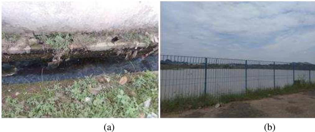
Gambar 3. (a) Kondisi Saluran Drainase RW 09 dan (b) Situ Kamojing

menyebabkan terjadinya pengikisan dan air pun meluap ke pemukiman warga. Tinggi genangan pada lokasi tersebut mencapai 0,25 m dengan durasi banjir selama 3 jam. Kondisi saluran RW 9 dapat dilihat pada Gambar 3.