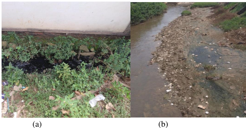
Gambar 4. (a) Kondisi Saluran Drainase Perumahan BMI 1 dan 2 dan (b) Sungai Cikaranggalam

Permasalahan banjir pada Desa Dawuan Tengah berada di Perumahan BMI (Bumi Mutiara Indah) 1 dan Desa Dawuan Barat di Perumahan BMI 2 yang merupakan dataran rendah dan dekat dengan saluran Irigasi Tarum Timur. Penyebab wilayah tersebut terkena banjir karena meluapnya saluran Irigasi Tarum Timur yang mendapat kiriman air dari Sungai Cikaranggalam apabila pintu air Situ Kamojing terbuka. Tinggi genangan pada BMI 1 dapat mencapai 0,5-0,75 m dan BMI 2 dapat mencapai 1-1,5 m dengan durasi banjir selama 3-4 jam. Kondisi saluran drainase eksisting di Perumahan BMI 1 dan 2 dapat di lihat pada Gambar 4.