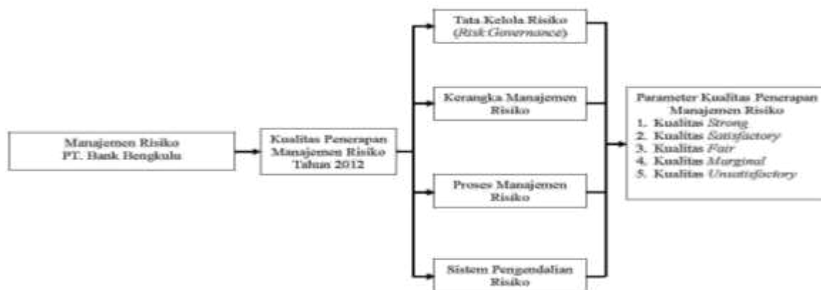
Gambar 2. Kerangka Analisis