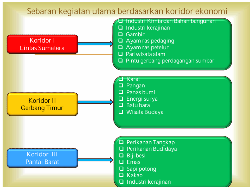
Gambar 1: Sebaran Kegiatan Utama Berdasarkan Koridor Ekonomi

Koridor Lintas Sumatera sebagai koridor 1, kegiatan utamanya adalah aktifitas ekonomi industry seperti industry kimia dan bahan bangunan serta industry kerajinan, peternakan dan wisata MICE,. Pada koridor ekonomi Gerbang Timur sebagai koridor ekonomi 2, kegiatan utamanya adalah aktifitas ekonomi industry perkebunan, pertambangan dan wisata budaya. Pada koridor ekonomi Pantai Barat kegiatan utamanya adalah indutsri perikanan tangkap dan budidaya, pertambangan dan industry kreatif. Dengan demikian dengan strategi pengembangan koridor ekonomi berdasarkan potensi ekonomi yang dimiliki, maka percepatan pembangunan wilayah dapat dilakukan.