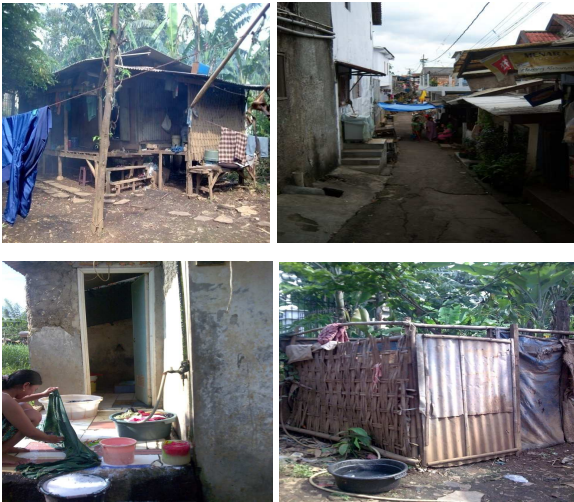
Gambar 6. Kondisi Permukiman

meliputi sejumlah indikator kualitas permukiman secara umum, profil penghuni serta sikap dan perilaku yang terkait dengan keberadaan sungai, yang meliputi aspek: a) prasarana dan kepemilikan rumah; b) prasarana fisik lingkungan; c) kondisi kesehatan; d) keterkaitan penduduk dengan sungai, e) profil ekonomi, serta f) kesulitan, keresahan dan harapan yang berkaitan dengan masalah sungai dan banjir.