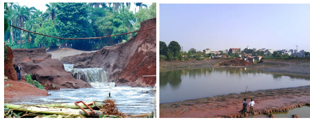
Gambar 1. Tanggul dan Suasana Situ Gintung

Upaya mencapai pembangunan berkelanjutan terkait dengan keseimbangan antara tiga aspek, yaitu lingkungan, ekonomi dan sosial. Bila sebelum tahun 1987 terjadi kecenderungan aktivitas manusia semata-mata terkait dengan ekonomi, maka setelah tahun 1987 dimulailah