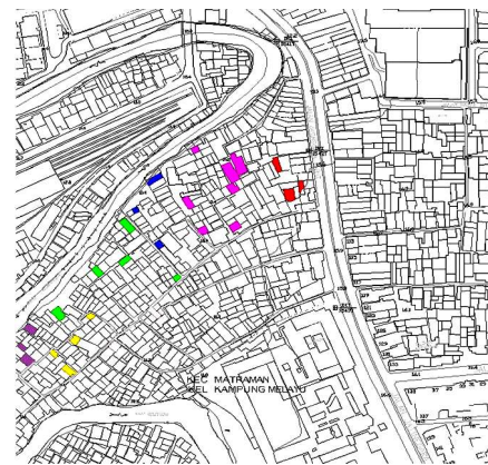
Gambar 4. Lokasi Penelitian di Kampung Pulo