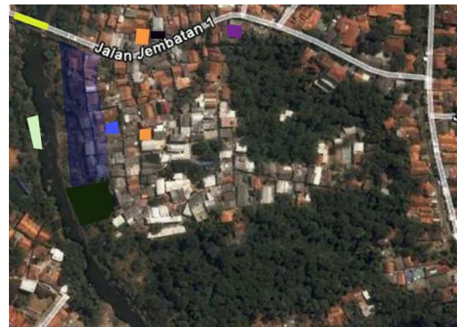
Gambar 3. Lokasi Penelitian di Bale Kambang

Data empiris pada penelitian ini diambil dari kelompok masyarakat di Kelurahan Bale Kambang, Condet (Gambar 3) dan Kelurahan Kampung Pulo, Kampung Melayu (Gambar 4) yang merupakan wilayah hilir DAS Ciliwung (Gambar 5). Tujuannya adalah untuk mendapatkan gambaran permasalahan yang jelas di