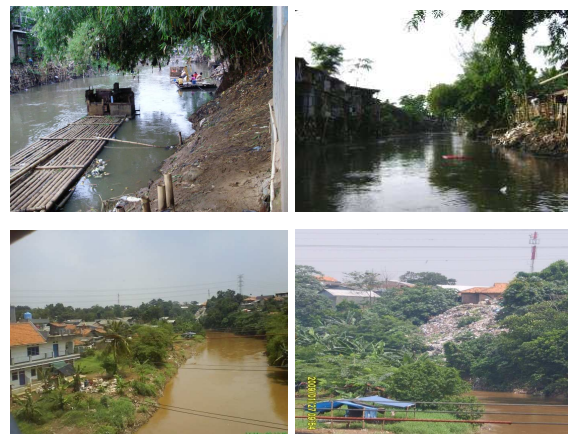
Gambar 5. Kondisi Lingkungan DAS

wilayah sungai, khususnya dari aspek kondisi manusia serta keterkaitannya dengan pengelolaan DAS pada skala yang lebih makro. Wilayah penelitian dipilih di hilir, untuk dapat menunjukkan permasalahan yang terjadi pada ujung fungsional sungai serta hubungannya dengan pengelolaannya.