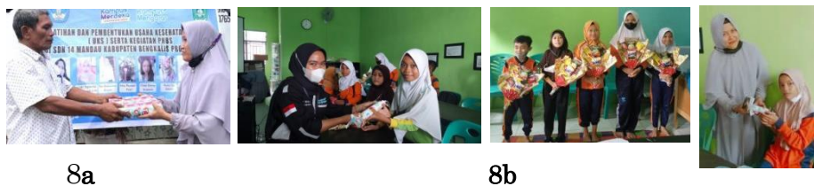
Gambar 8a. pemberian hadiah dan Kenang-kenangan pada bapak Kepala sekolah. 8b. pemberian bingkisan bagi peserta yang memiliki nilai tertinggi, sehingga memberikan semangat dan kebahagiaan bagi para peserta pasca kegiatan PKM dilaksanakan.

kebersihan tangan, pentingnya menu seimbang anak sekolah, dan menjaga kesehatan tubuh anak sekolah.