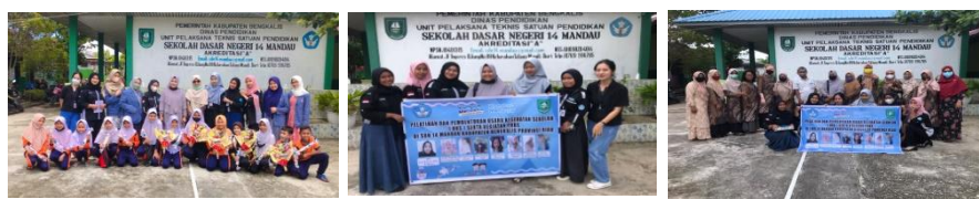
Gambar 9. Foto bersama setelah kegiatan pelatihan dan coaching bersama tim PKM, (DPL, mahasiswa KM2 dan mahasiswa kebidanan STIKes Payung Negeri), kepala sekolah dan staf guru serta siswa SD.

Kami memberikan pesan dan menganjurkan agar semua peserta pelatihan melaksanakan semua anjuran dan saran yang sudah disampaikan, seperti rajin menjaga personal hygiene menggosok gigi, memotong kuku dan sering cuci tangan dalam masa pandemic ini.