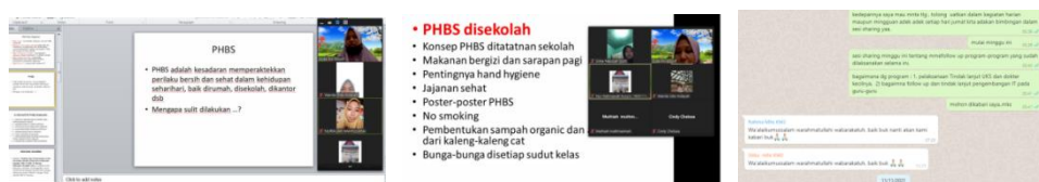
Gambar 10. menunjukkan proses sesi sharing terkait tindak lanjut / pemantauan kegiatan yang sudah dilaksanakan pasca pelatihan.

Tim PKM memantau tindak lanjut pasca pelatihan dengan diskusi via online via zoom dan chatting via Aplikasi Grup WhatsApps