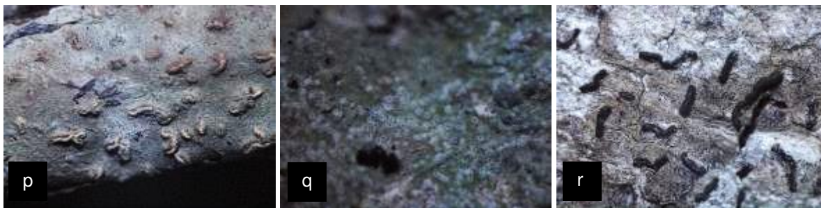
Gambar 2. Jenis lichen, a. Parmotrema tictorum , b. Graphis cincta , c. Pyrenula sp.1, d. Fissurina sp., e. Lecanora sp., f. Parmotrema sp., g. Diorygma sp.2, h. Cladonia sp., i. Pyrenula sp.2, j. Leptogium sp., k. Heterodermia sp., l. Pannaria sp., m. Lobaria pulmonaria , n. Phaeophyscia sp., o. Pyrenula sp.3, p. Fissurina sp.2, q. Myriotremia sp., r. Graphis sp.

epifit pada permukaan kulit batang atau ranting pohon didukung oleh berbagai faktor yaitu tekstur batang, kemampuan menahan air, dan struktur kulit batang yang keras (Ellis 2013).