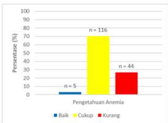
Gambar 2. Distribusi responden berdasarkan pengetahuan mengenai Anemia

Ibu hamil dikategorikan mengalami anemia bila pada hasil pemeriksaan Hb didapatkan < 10,5 gr/dL untuk ibu hamil trimester II dan < 11 gr/dL untuk ibu hamil trimester III. Berdasarkan Gambar 1 diketahui bahwa sebanyak 83 ibu hamil (50,3%) mengalami anemia dan sebanyak 82 (49,7%) tidak mengalami anemia (Gambar 1).