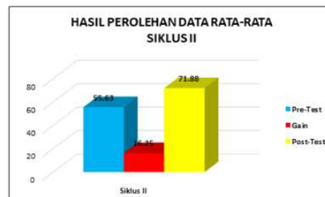
Gambar 2. Grafik Perolehan Rata-rata Hasil Belajar

Seperti terlihat pada Tabel 8 di atas, dari hasil perhitungan uji - t taraf signifikan 5% diperoleh t_{hitung} = 11,59 dan t_{tabel} = 1,695 . Karena t_{hitung} > t_{tabel} maka hipotesis no (Ho) ditolak, dilain pihak hipotesis alternative (Ha) diterima. Berarti terdapat perbedaan signifikan hasil belajar siswa dengan penerapan metode audio visual pada siklus II di kelas PTK.