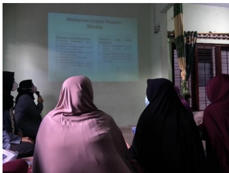
Gambar 1. Pelaksanaan Kegiatan Pengabdian.

Menurut (Ika et al., 2021) caregiver mempunyai peran besar dalam melakukan perawatan stroke namun selalu tidak siap menjalani perannya karena kurangnya kebutuhan informasi dan pengetahuan dalam merawat pasien stroke. Penggunaan metode Position dapat dilakukan dan dipraktekkan dengan baik oleh peserta dalam melatih motorik bagian ekstremitas atas dan bawah, menurut (Anita et al., 2018) latihan ROM dapat membantu mengurangi resiko atropi otot pada pasien stroke jika dilakukan secara rutin. Penggunaan metode Instruction dengan melatih verbal pasien dapat dilakukan dengan baik oleh peserta. Menurut (Astriani et al., 2019) terapi verbal dapat mengurangi gejala afasia motoric pada pasien stroke jika dilakukan secara teratur. Penggunaan metode Puzzle juga dapat dilakukan peserta dengan baik serta mampu dipraktekkan, menurut (Stiawan et al., 2018), permainan yang mengasah otak seperti brain gym dapat membantu mengembalikan memori jangka pendek pada pasien stroke. Setelah melakukan kegiatan ini terjadi peningkatan pengetahuan dimana dari 12 orang peserta yang di supervisi didapatkan hasil pada saat pretest nilai rata-rata pengetahuan 12 dan terjadi peningkatan nilai rata-rata pengetahuan pada saat posttest menjadi 18 setelah dilakukan intervensi.