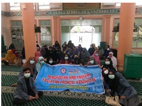
Gambar 2. Pelaksanaan Kegiatan Pengabdian.

Gambar di atas menunjukkan kegiatan dalam mengenalkan dan menjelaskan metode PIP ( Position, Instruction, Puzzle ) sebagai intervensi dalam merawat anggota keluarga dengan stroke.