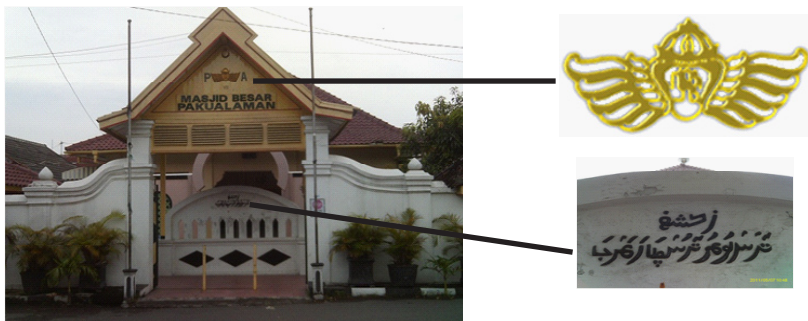
Gambar E.4 Gapura Utama Masjid dengan Simbol Kerajaan Pakualaman

Simbolisasi makna-makna lain secara lebih utuh pada bangunan masjid yang mengandung nilai-nilai yaitu dapat dilihat dari perpaduan struktur bangunan. Atap berbentuk piramida bersusun tiga, ruang-ruang yang harus dilewati sebelum menuju pengimaman, dan gapura-gapura yang melengkapi bangunan masjid. Atap dan gapura masjid melambangkan bangunan candi dimana pada bangunan candi terdapat tiga tingkatan sebelum menuju puncak. Sama halnya dengan bangunan Masjid Pakualaman, sebelum sampai pada ruang pengimaman yang dipandang paling sakral seorang muslim harus melewati genangan air (kolam) untuk mensucikan badan kemudian serambi, ruang utama dan baru mihrob atau pengimaman.