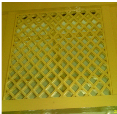
Gambar E.2 Ornamen Ventilasi Berbentuk Rumah Lebah Berwarna Kuning

Kemudian nilai-nilai luhur juga terkandung pada ornamen-ornamen masjid lainnya seperti ornamen pada ventilasi yang berbentuk rumah lebah dan ornamen pada mimbar. Ornamen pada ventilasi dimaksudkan agar senantiasa seorang muslim dalam kehidupannya mencari penghidupan dengan jalan yang baik, yaitu menyerap sari-sari bunga yang manis dan mengeluarkan perbuatan yang manis seperti madu dengan kemanfaatan yang begitu besar bagi manusia lain.