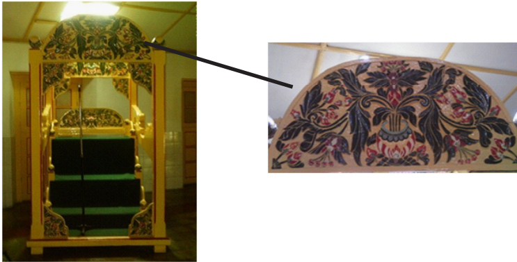
Gambar E.3 Mimbar dengan Kekhasan Ornamen Bunga

Simbolisasi makna-makna lain secara lebih utuh pada bangunan masjid yang mengandung nilai-nilai yaitu dapat dilihat dari perpaduan struktur bangunan. Atap berbentuk piramida bersusun tiga, ruang-ruang yang harus dilewati sebelum menuju pengimaman, dan gapura-gapura yang melengkapi bangunan masjid. Atap dan gapura masjid melambangkan bangunan candi dimana pada bangunan candi terdapat tiga tingkatan sebelum menuju puncak. Sama halnya dengan bangunan Masjid Pakualaman, sebelum sampai pada ruang pengimaman yang dipandang paling sakral seorang muslim harus melewati genangan air (kolam) untuk mensucikan badan kemudian serambi, ruang utama dan baru mihrob atau pengimaman.